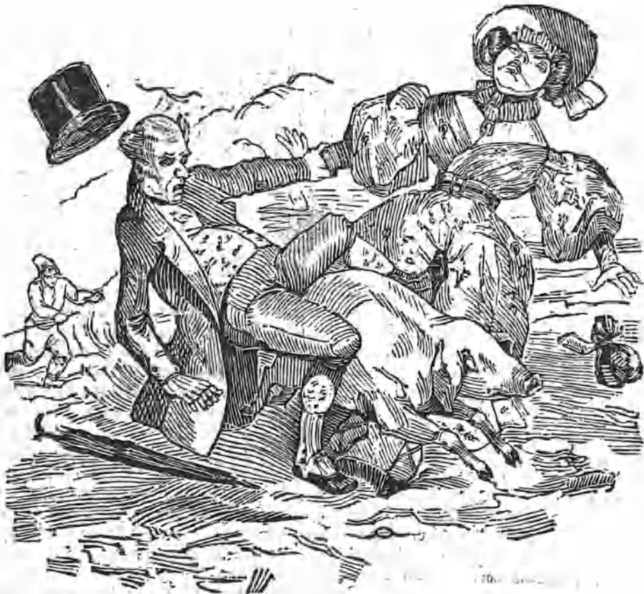
UN PASEO INTERRUMPIDO.

A cosa de las cinco subieron las señoras á sus coches, dirigiéndose á la grande calle del Prater en donde empezaba el paseo. Dos grandes hileras de elegantes carruages circulaban por ambos lados, dejando el medio para los de cuatro caballos: el contrapaseo de la derecha es para los de á caballo, y el de la izquierda para la gente de á pie; pero lo que no puede imaginarse quien no la haya visto es la belleza de los sitios de este paseo; el admirable verdor de los árboles, los dilatados prados que los rodean, la embalsamada frescura del ambiente, y la diversidad de equipages rusos, húngaros, polacos que van pasando sucesivamente por delante de uno. Al ponerse el sol, cada uno se retira; el Prater va quedando poco á poco desierto, y la muchedumbre que le llenaba se encamina hacia los infinitos gasthauser de Viena y sus arrabales para acabar de celebrar dignamente con el vaso en la mano el primer día del mes de Mayo aguardado con tanta impaciencia, y tan cordialmente solemnizado.