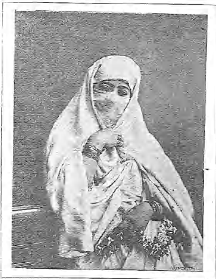
Entre españoles y moras Hay una gran diferencia;