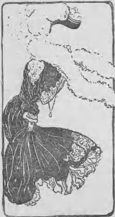
Lo que ven las mujeres.