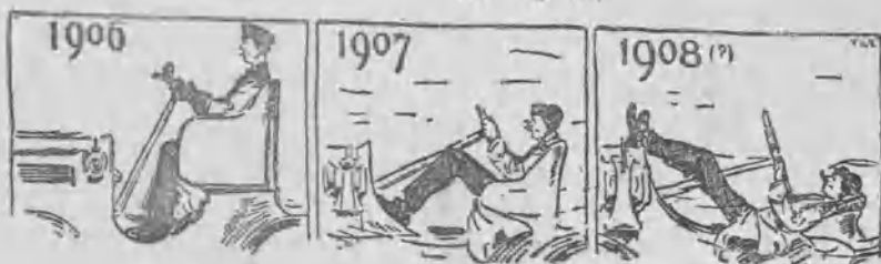
El progreso del automovilismo hacia la comodidad.

Pero le han banquetado por el éxito alcanzado.