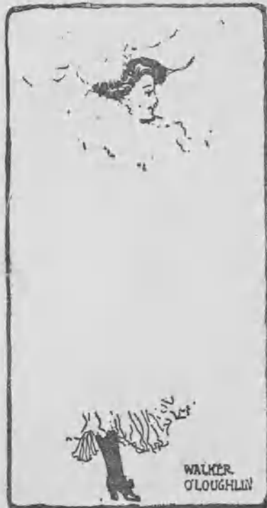
Lo que ven los hombres.