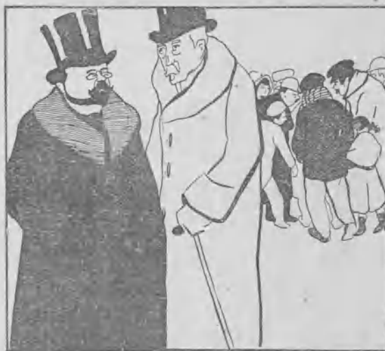
El suceso de toda la semana.

—¿Ha visto usted ese hombre que había en medio de la calle?