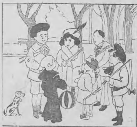
Los niños en Recoletos.

—No sé lo que come esa gente para morirse de esa manera.