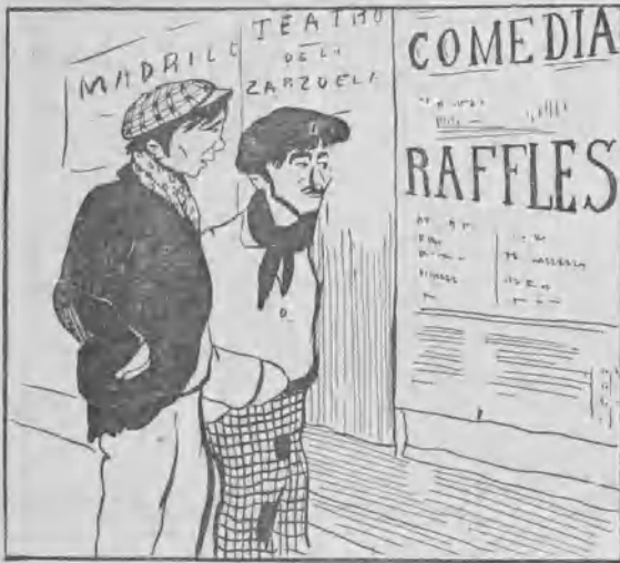
Los ladrones en el teatro.

—Ya lo ves; pa que venga la gente han tenido nesecidad los autores de echar mano de uno de nosotros: Raffles en la Comedia y El ladrón en el Español.