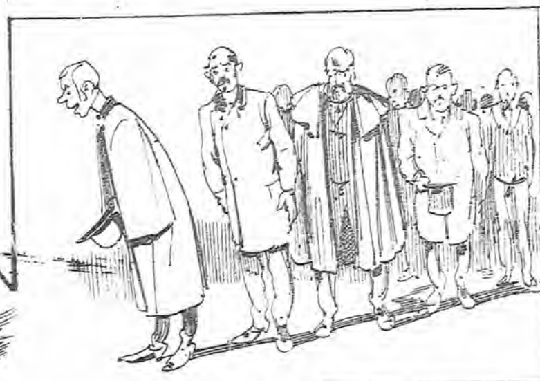
Y una multitud inmensa de espectadores.