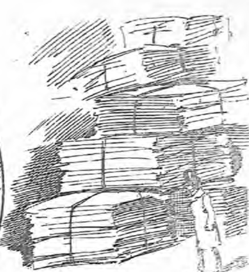
Entretanto la causa por homicidio creaba un follón que era una bendición.