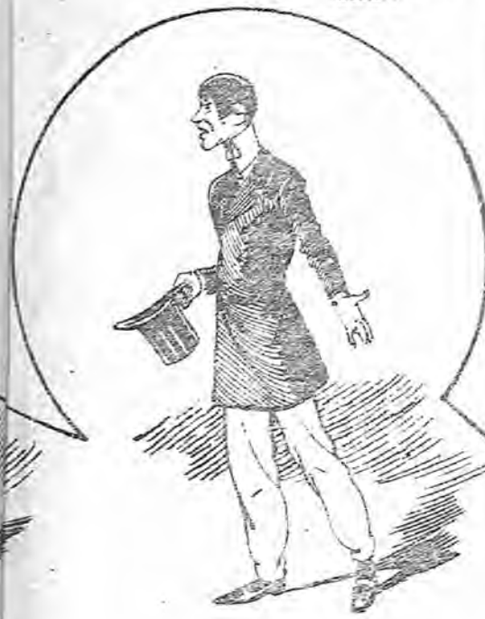
El primer galán.