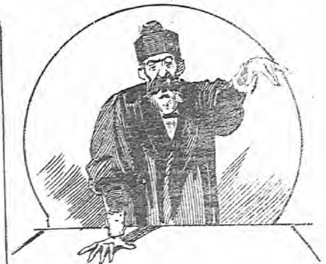
Que sirvió al abogado para demostrar palpablemente que el reo estaba loco.