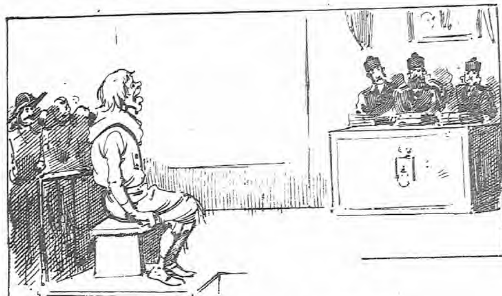
Y llegó, por fin, el terrible momento del juicio oral.