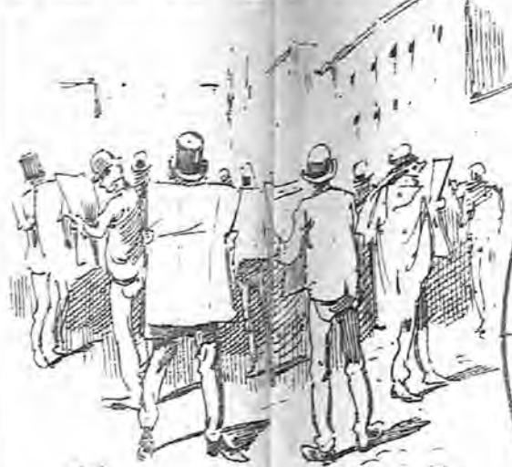
Los periódicos reseñaron con vivos colores el crimen de anoche, cuyos raros detalles devoraba el público con avidez.