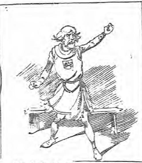
Don Nuño, sin poder contenerse, echando chispas por los ojos, se levantó á protestar, contó su verdadera historia con todos sus pelos y señales....