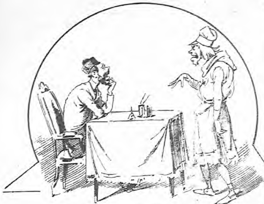
En cuanto el juez empezó el interrogatorio, comprendió que nuestro hombre había bebido demasiado.