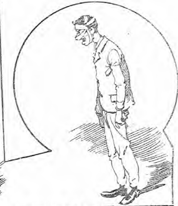
El apuntador, con la cabeza vendada todavía.