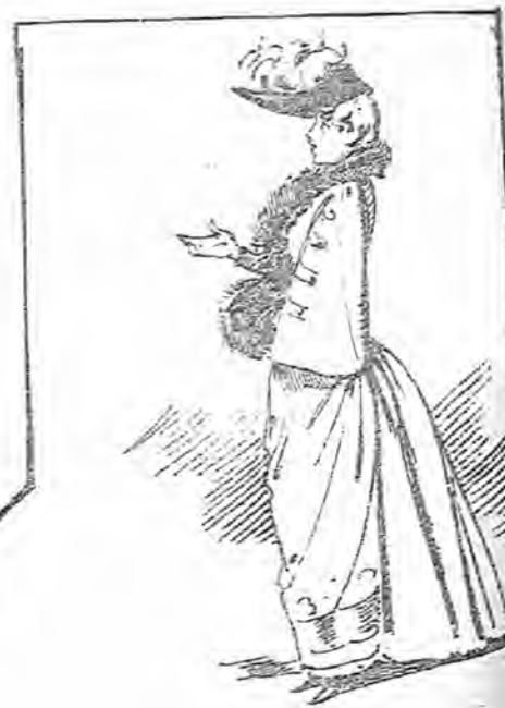
Declaró la primera dama.