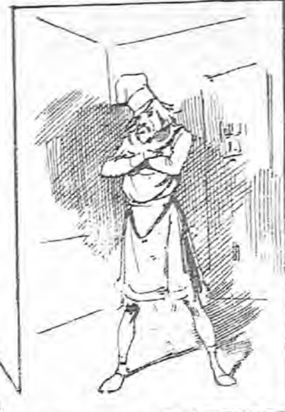
Lo cual no fue obstáculo para que le encerraran preventivamente en una celda de la cárcel modelo.