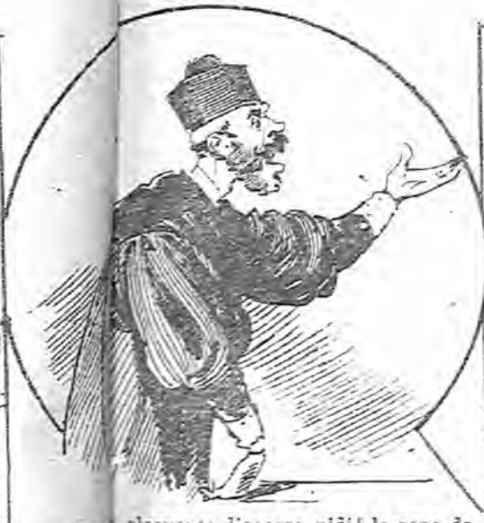
El fiscal, en un elocuente discurso, pidió la pena de cadena perpetua para el acusado, con más la inhabilitación perpetua que es lo más fastidioso.