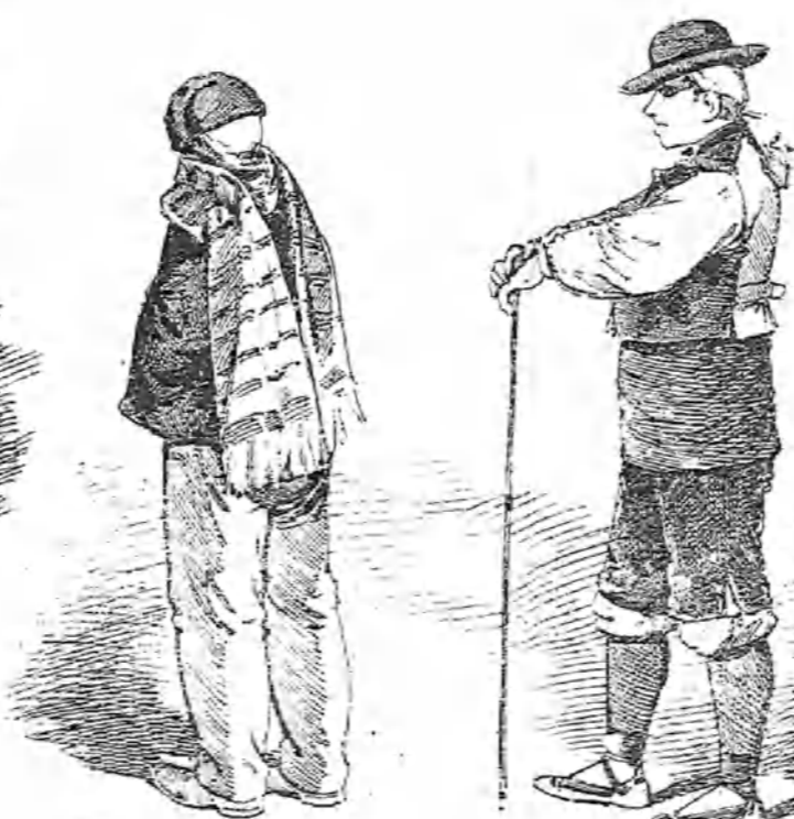
Como prueba este tipo hay en esta región, recuerdos de Navarra, Castilla y Aragón.