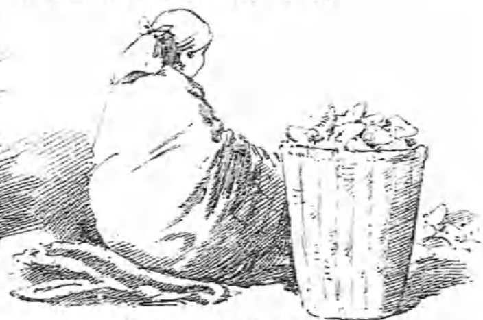
Y es lo que yo digo: ¿quién diablos se comerá tantos pimientos?