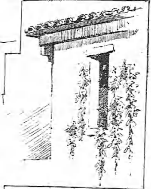
Las fachadas sencillas se adornan con pimientos y guindillas.