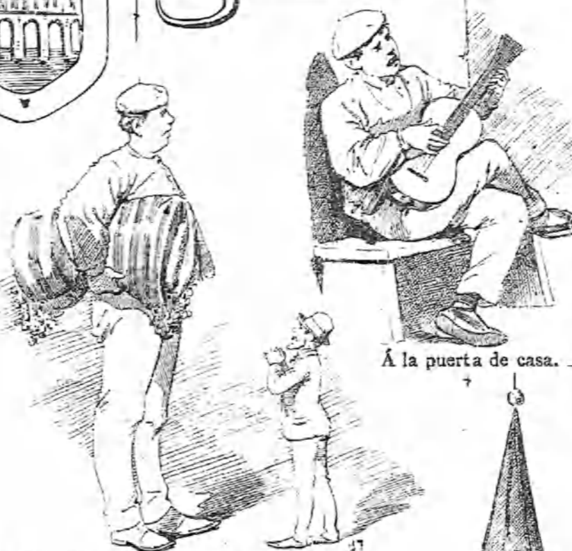
Á la puerta de casa.