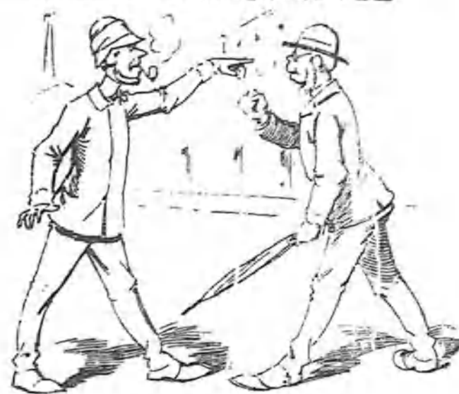
Y como mediaban entre ellos resentimientos personales,