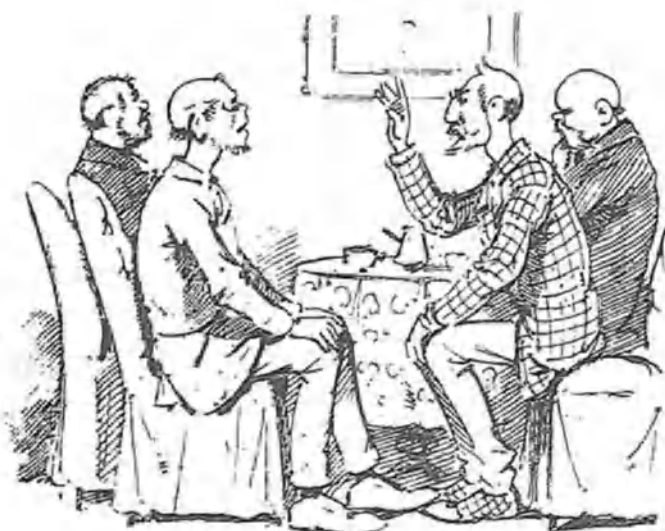
Intervinieron inmediatamente los amigos,