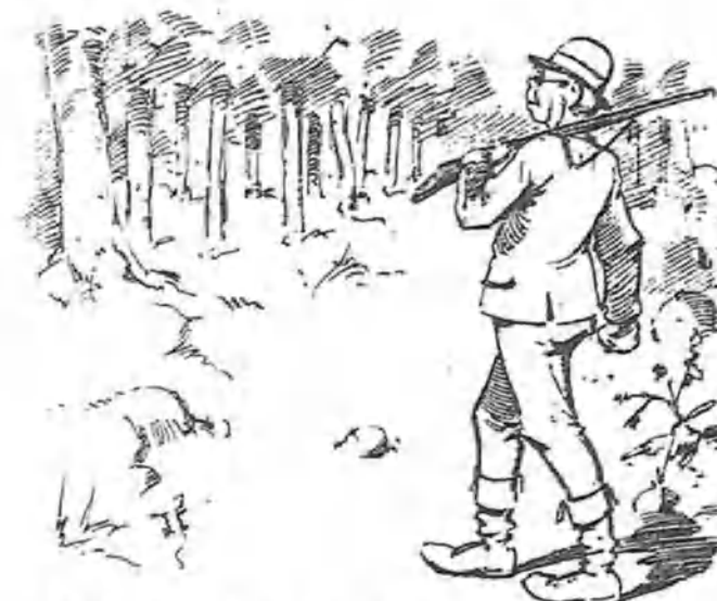
Y á la misma hora Sir Power, habitante en la misma calle, dos casas más arriba, penetraba también por la parte del Noroeste.