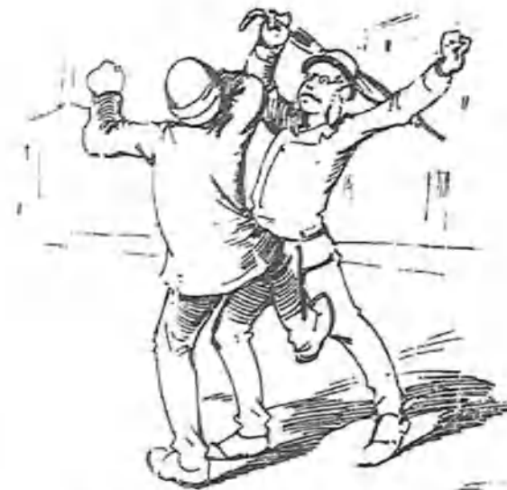
el tropezón fué la causa ocasional de que vinieran á las manos.