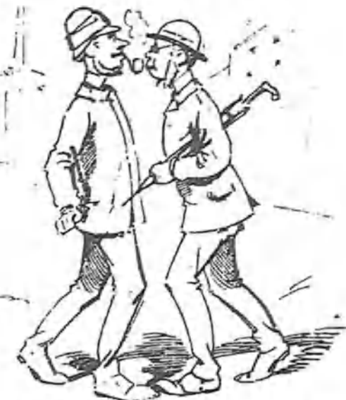
tuvo la desgracia de tropezar en su camino con Sir Power, habitante en la misma calle, dos casas más arriba.