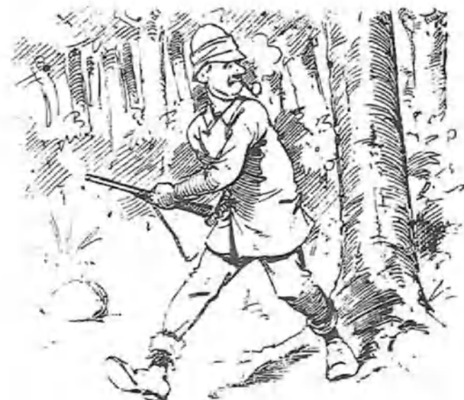
Preparándose y amartillando al menor ruido, para evitar una sorpresa.