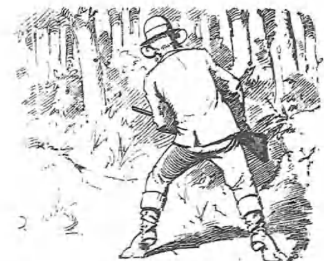
Y volviéndose todo oídos para no ser atacado por la espalda.