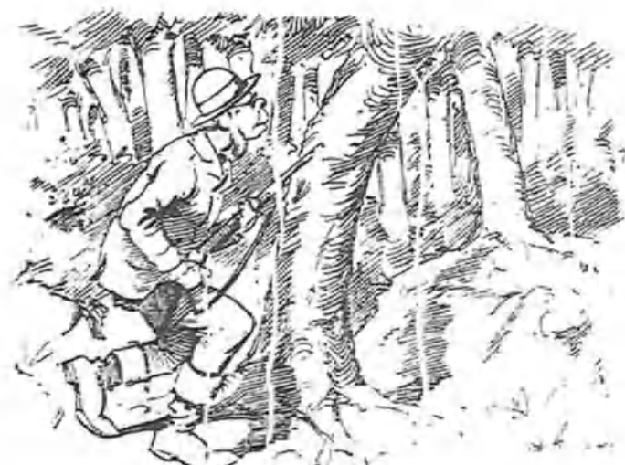
Sir Power, por el otro lado, avanzaba también, ocultándose tras de los árboles.