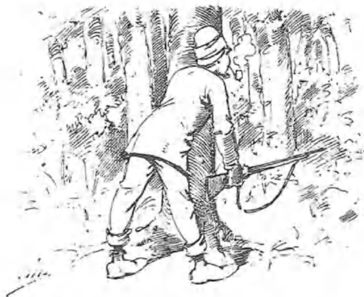
Sir James, considerando que la cosa era grave, avanzó con precauciones infinitas.