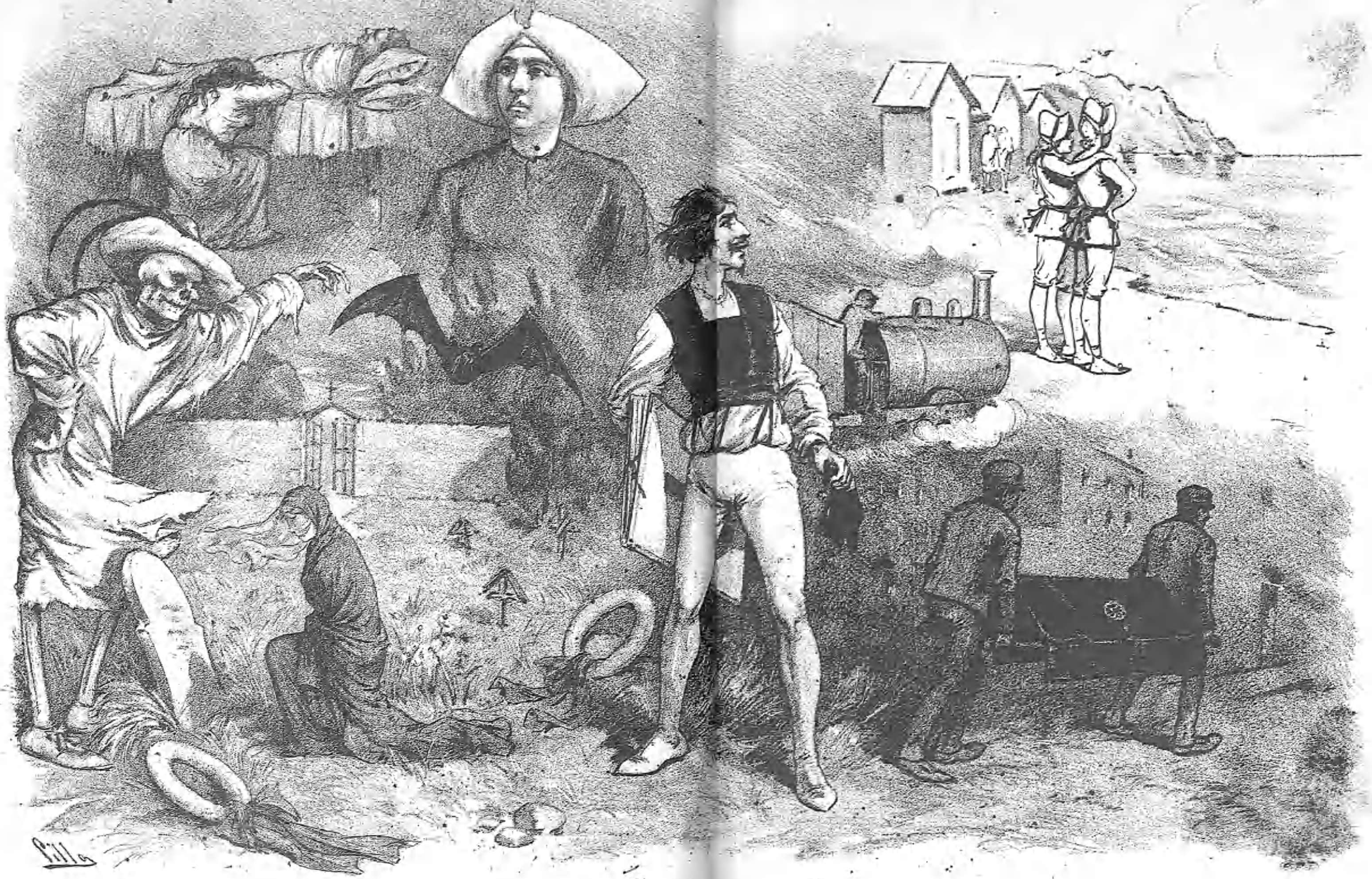
El cólera de este año *