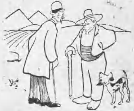
—Oiga usted, buen hombre, ¿hay muchas fieras por aquí?