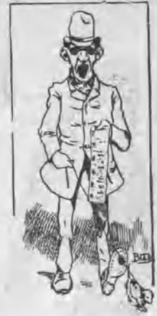
—¿A quién le hace falta dinero?