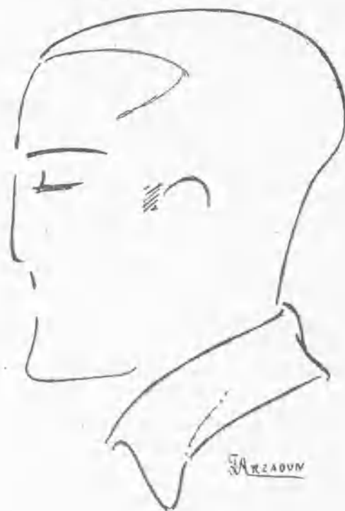
EL CONDE DE GIMAR CAMPEÓN INTERNACIONAL DE TENNIS

tes carreras ciclistas, cuyo recorrido era de 1.000 metros.