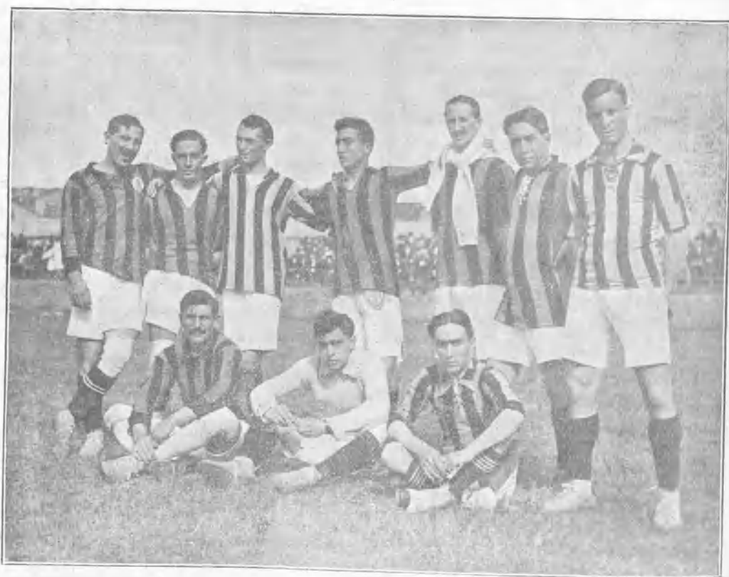
EL EQUIPO CORUÑÉS QUE Luchará EN MADRID EL PRÓXIMO DICIEMBRE

Creo que no, y es más, no sé si seré malicioso; pero el señor Dieste aceptó el arbitrar precisamente porque sabía que no se podía jugar, y de esa forma evitaba las