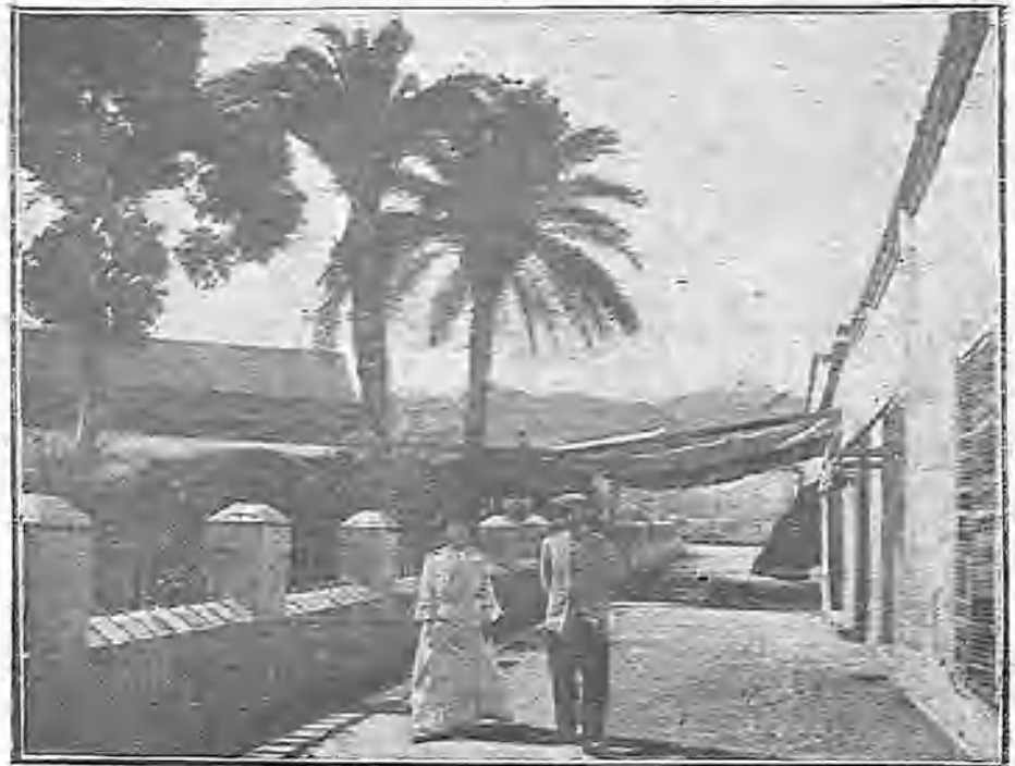
ENTRADA AL PENAL

¿Cuándo se ocuparán nuestros gobernantes del sistema penitenciario? ¿Cuándo serán reemplazados los vetustos edificios habilitados para