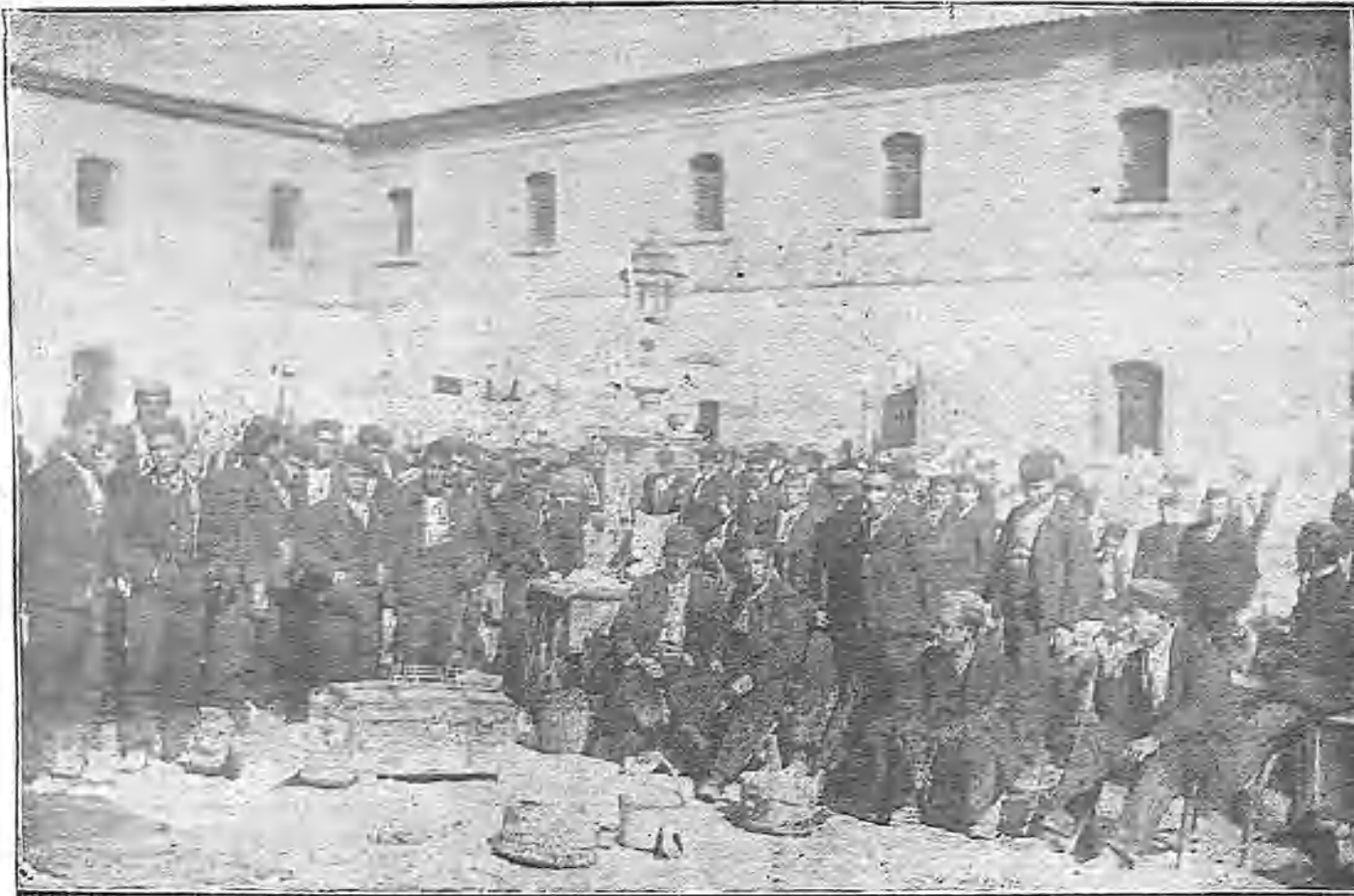
LA POBLACIÓN PENAL EN EL PATIO