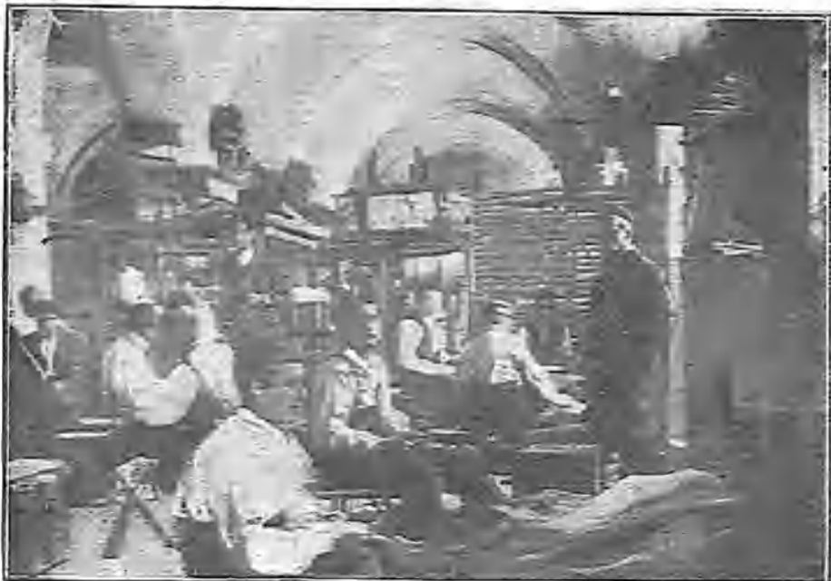
UN TALLER DE TEJIDOS EN EL PENAL