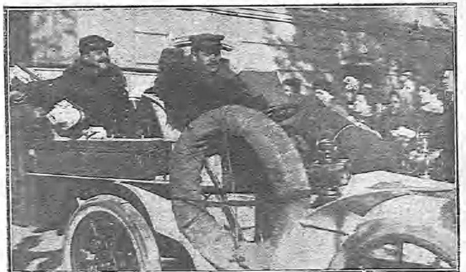
LOS RECIÉN CASADOS, SALIENDO DE SU PALACIO EN AUTOMÓVIL DESPUÉS DE LA CEREMONIA