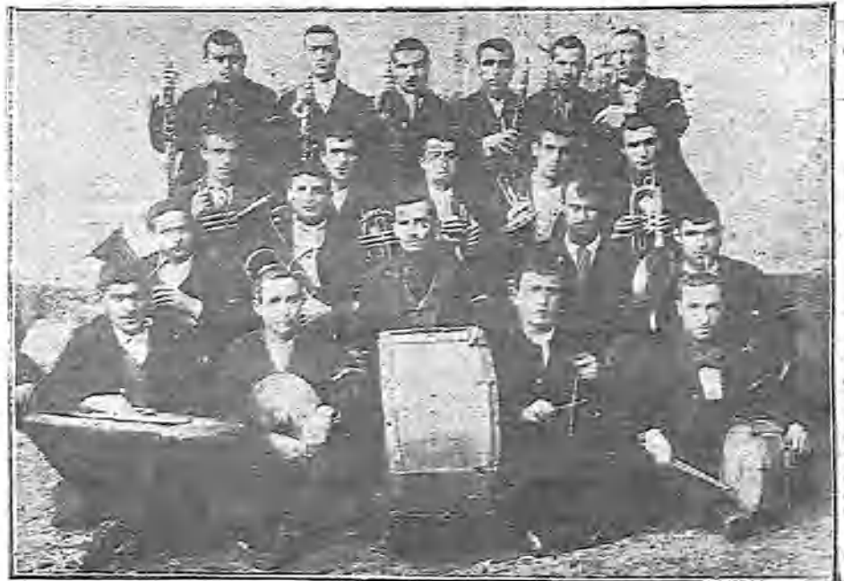
BANDA DE MÚSICA. COMPUESTA POR LOS PENADOS