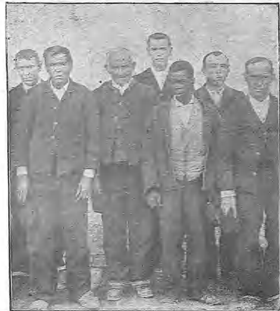
UN GRUPO DE PENADOS «ESCOGIDOS»

Los pedidos pueden hacerse á su autor, el comandante Escribano, Pozo, 4, principal, Madrid, quien también admite suscripciones trimestrales al precio de 1,50 pesetas.