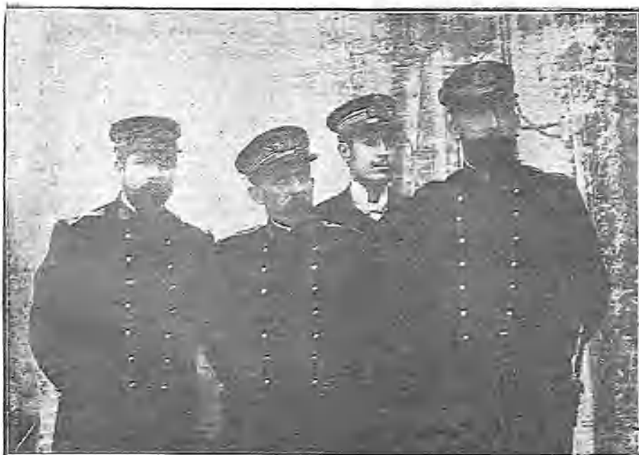
EL INSPECTOR, DIRECTOR, MAESTRO Y OFICIAL DE LA PRISIÓN