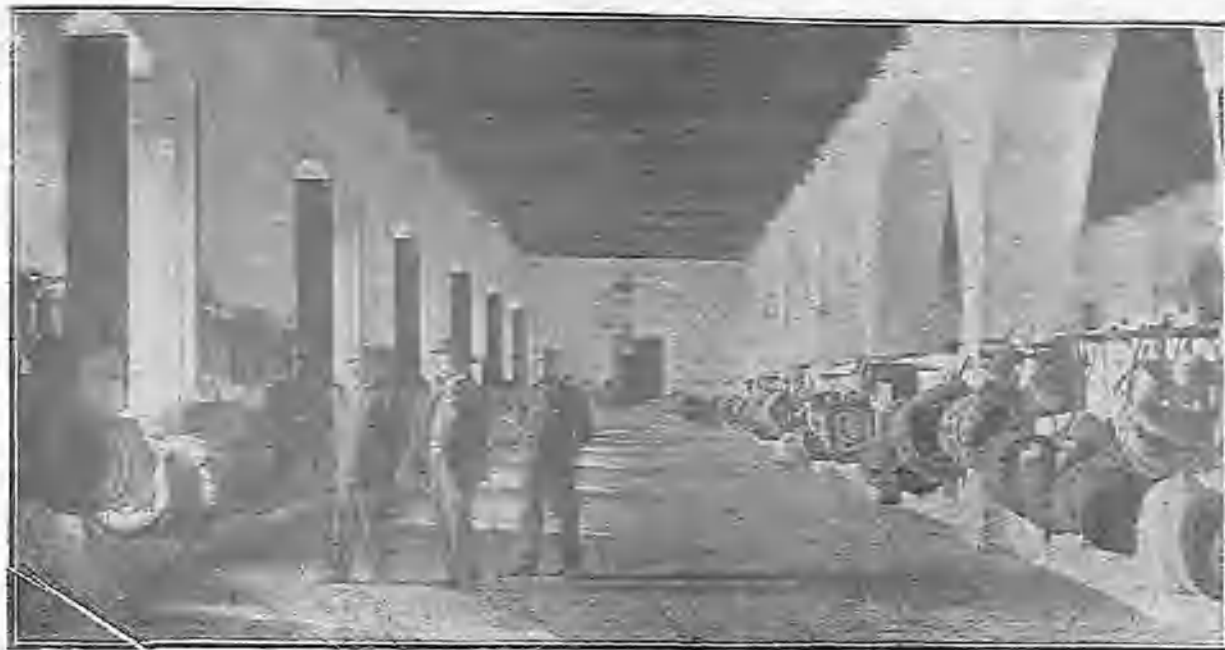
UN DORMITORIO DEL PENAL