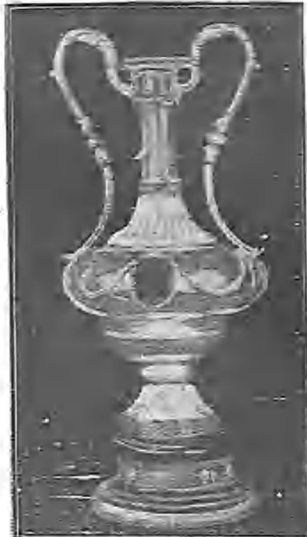
PREMIO OFRECIDO POR S. M. EL REY DON ALFONSO XIII PARA LOS JUEGOS FLORALES DE BUENOS AIRES

El papel que resulta pasa por quince ó veinte