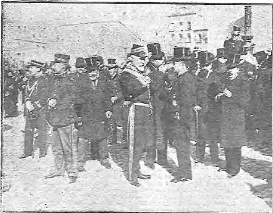
EL SEÑOR MAURA Á LA PUERTA DEL TEMPLO

A la hora anunciada dió principio la ceremonia, en la que ofició, revestido de