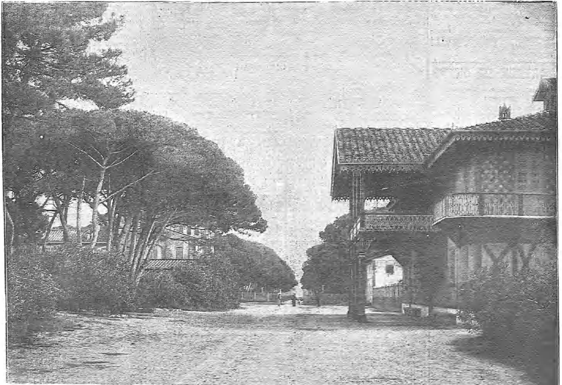
LA VILLA REAL DE SAN ROSSORE, DONDE RESIDEN LOS REYES DE ITALIA DESDE QUE SALIERON DE RACCONIGI Y EN LA QUE PERMANECERÁN HASTA SU REGRESO Á ROMA