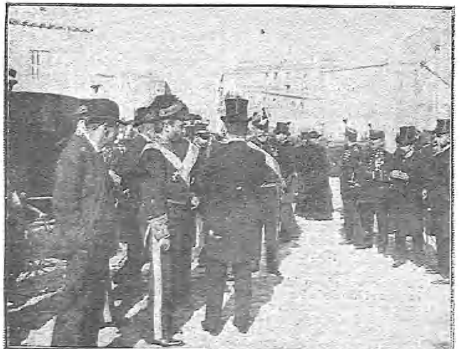
LOS MINISTROS SALIENDO DE LA IGLESIA