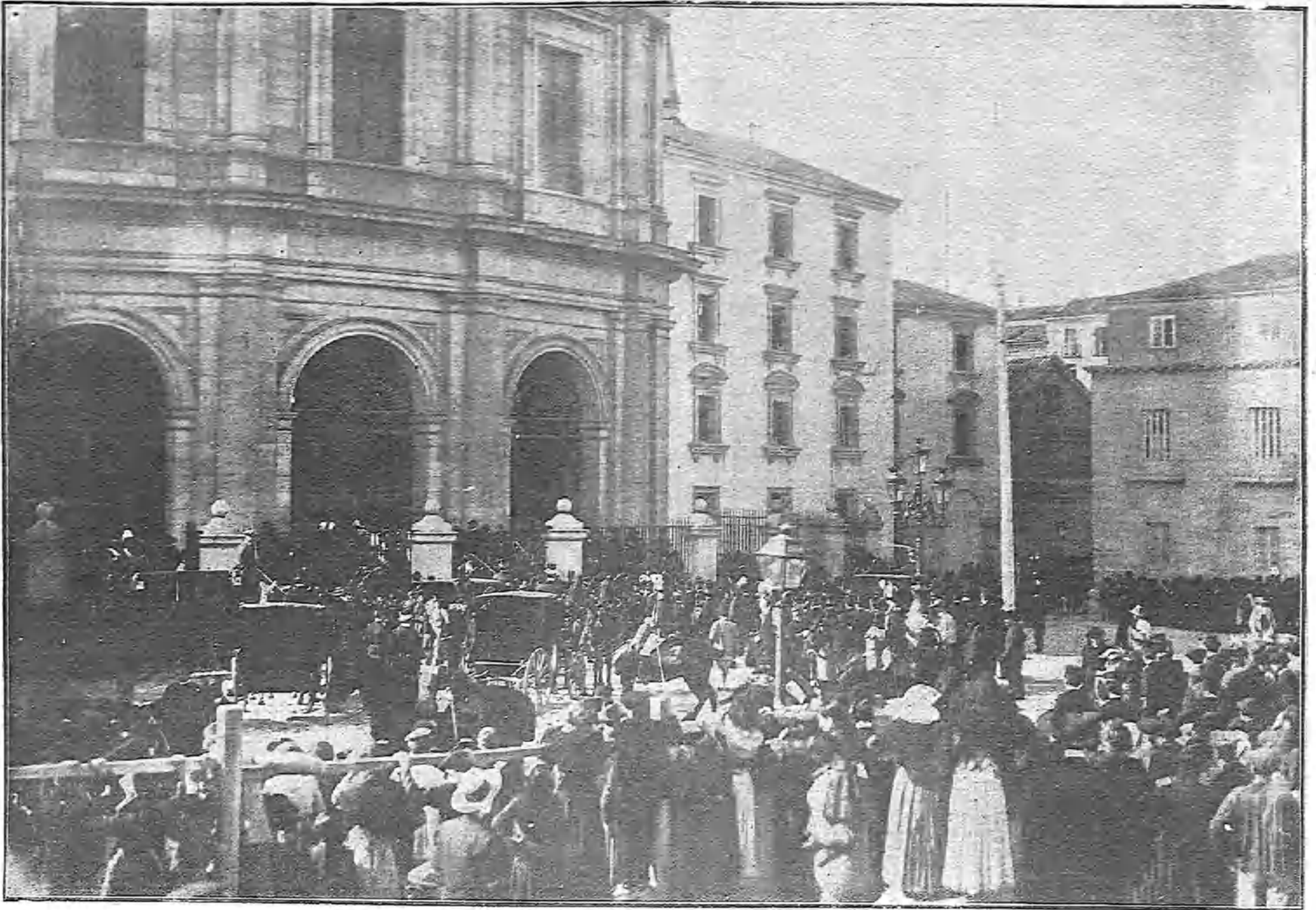
LA PLAZA DE SAN FRANCISCO EL GRANDE MOMENTOS ANTES DE COMENZAR LA SOLEMNE CEREMONIA