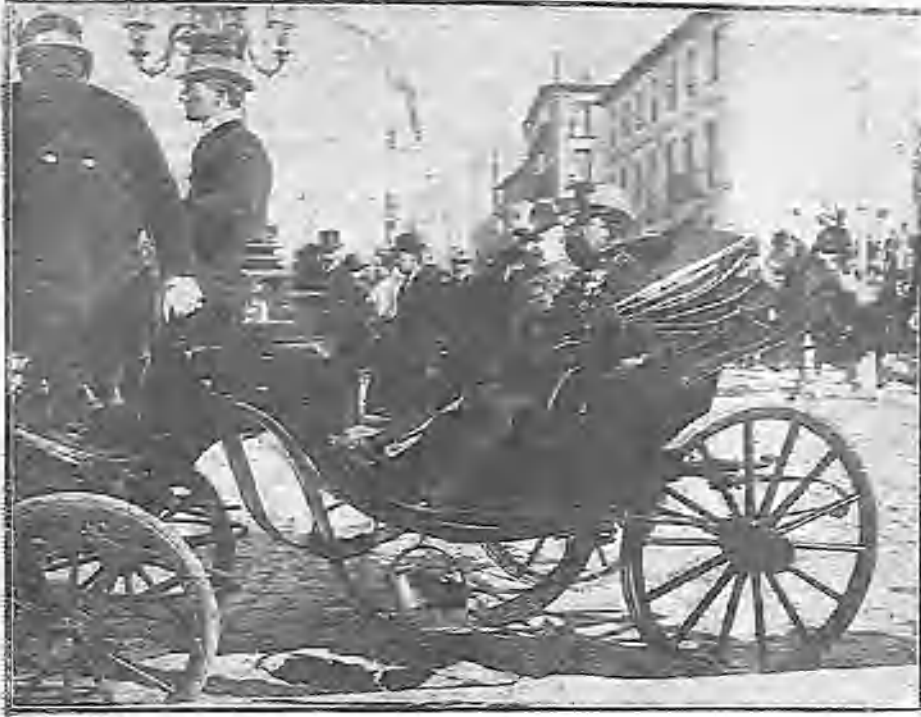
UN REPRESENTANTE EXTRANJERO DIRIGIÉNDOSE Á LA IGLESIA