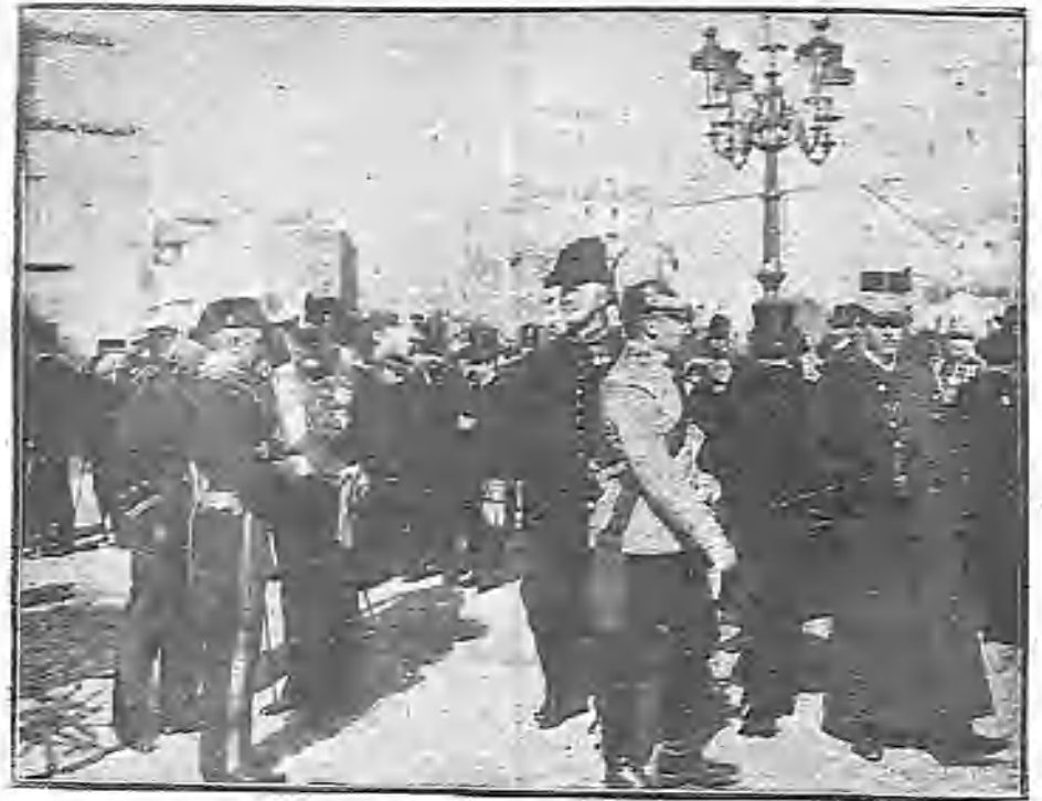
DIPLOMATICOS EXTRANJEROS Y ÁGREGADOS MILITARES