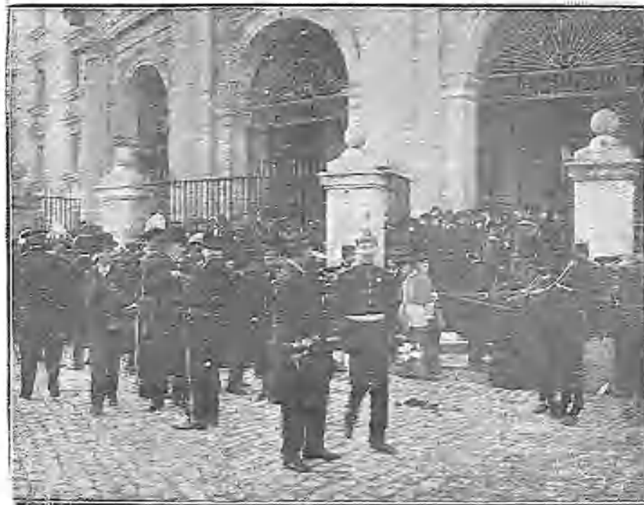
SALIENDO DE LA CEREMONIA

Durante la celebración de los funerales, una batería de Artillería, situada en las Vistillas, disparó las salvas de ordenanza en señal de duelo.