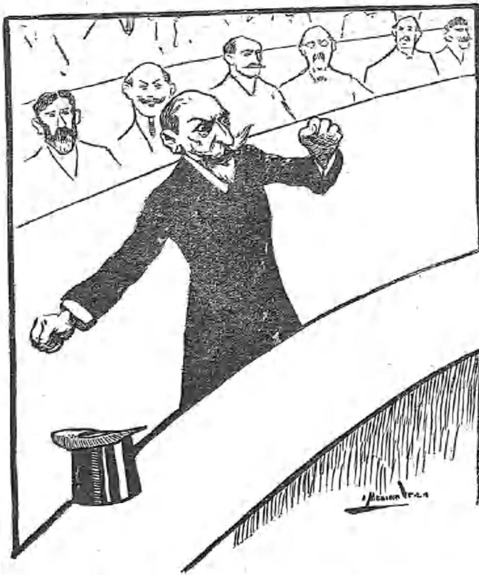
—Pensabais que había de rendirme a las amenazas de las oposiciones, que se mostraban tan nervas? No, y mil veces no. —Conste bien, señores diputados, conste para siempre ante quienes juzgan en toda su energía: yo no capitulo. — en el Parlamento.