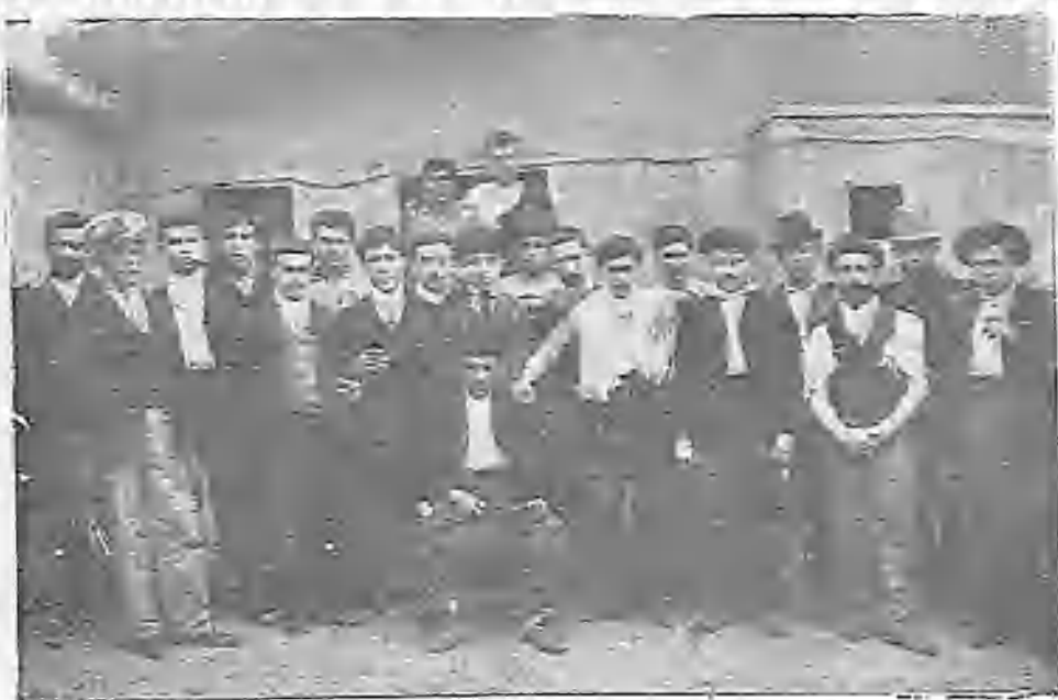
GRUPO DE HUELQUISTAS PRESOS, QUE EN BREVE SERÁN PUESTOS EN LIBERTAD