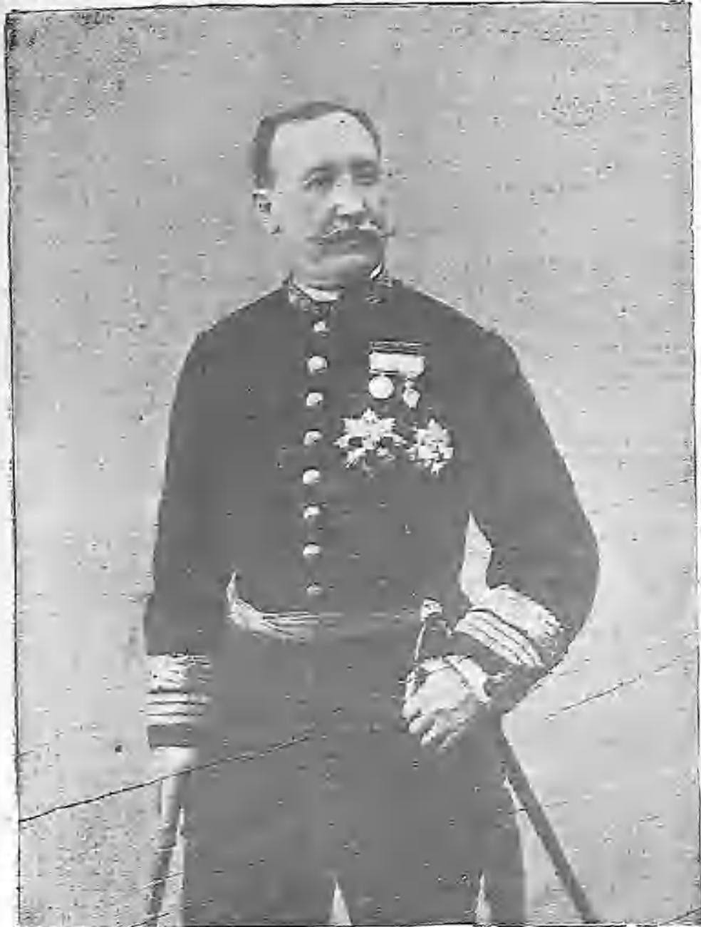
EL GENERAL MACÍAS

uniforme del Ejército, porque ofrece una tristísima actualidad el hecho de que el general Linares, el hombre que se dió clara cuenta de la distancia que media entre Gerona y Santiago de Cuba,