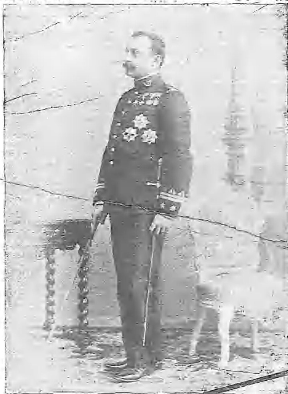
DON MIGUEL PRIMO DE RIVERA

Si luego la Historia advierte que allí faltó algo; que una página roja parecía obligada; que la indignación patria debió sublevarse, será tiempo de afirmar que los españoles habíamos alborotado el mundo en demasía y que el uso de la resignación estaba muy recomendado á los que derrocharon antes las energías.