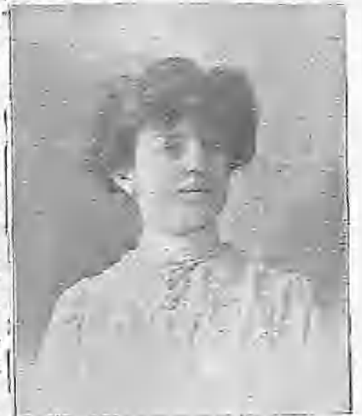
LA PRESIDENTA DE LA SOCIEDAD DE MODESTAS