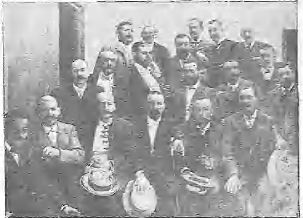
CELEBRADO AYER TARDE EN EL CAMPO DEL RECREO