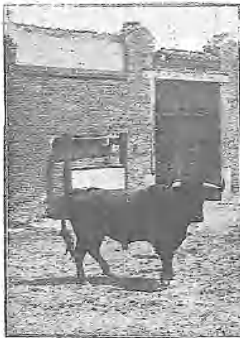
TORO LIDIADO HOY Y QUE POR SU BRAVURA TUVO QUE SER SEPARADO DE LOS DEMAS DESPUES DE ACOMETERLOS FIERAMENTE. ERA UNO DE ESOS BICHOS DE LOS CUALES DICEN LOS VAQUEROS: «HAY QUE DARLES DE COMER APARTE».

de cosas, y es fácil que la consecuencia en alargarlo produzca una nueva víctima.