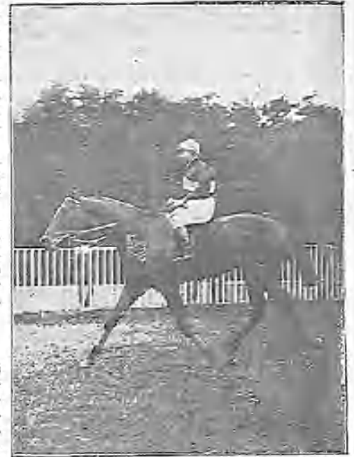
EL VENCEDOR EN LA CARRERA DEL "GRAND PRIX"

Sin embargo, la temperatura media en los tres meses de estío no pasa de 12 grados en el Norte y 25 en el Sur.