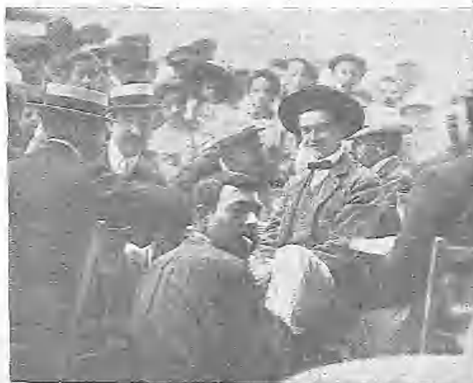
Bombita se hace limpiar las botas en la calle de Alcalá ante la expectación de los gobernados de Maura y de los futuros lectores de la «Historia de la Ética» del Sr. Silvela

La otra tarde le vi dormido—¿y cómo no?—en un pupitre de la nueva biblioteca, la cabecita reclinada sobre un libro forrado en vacari. ¿Que el pergamino tiene sin igual frescura? Ya lo sé.