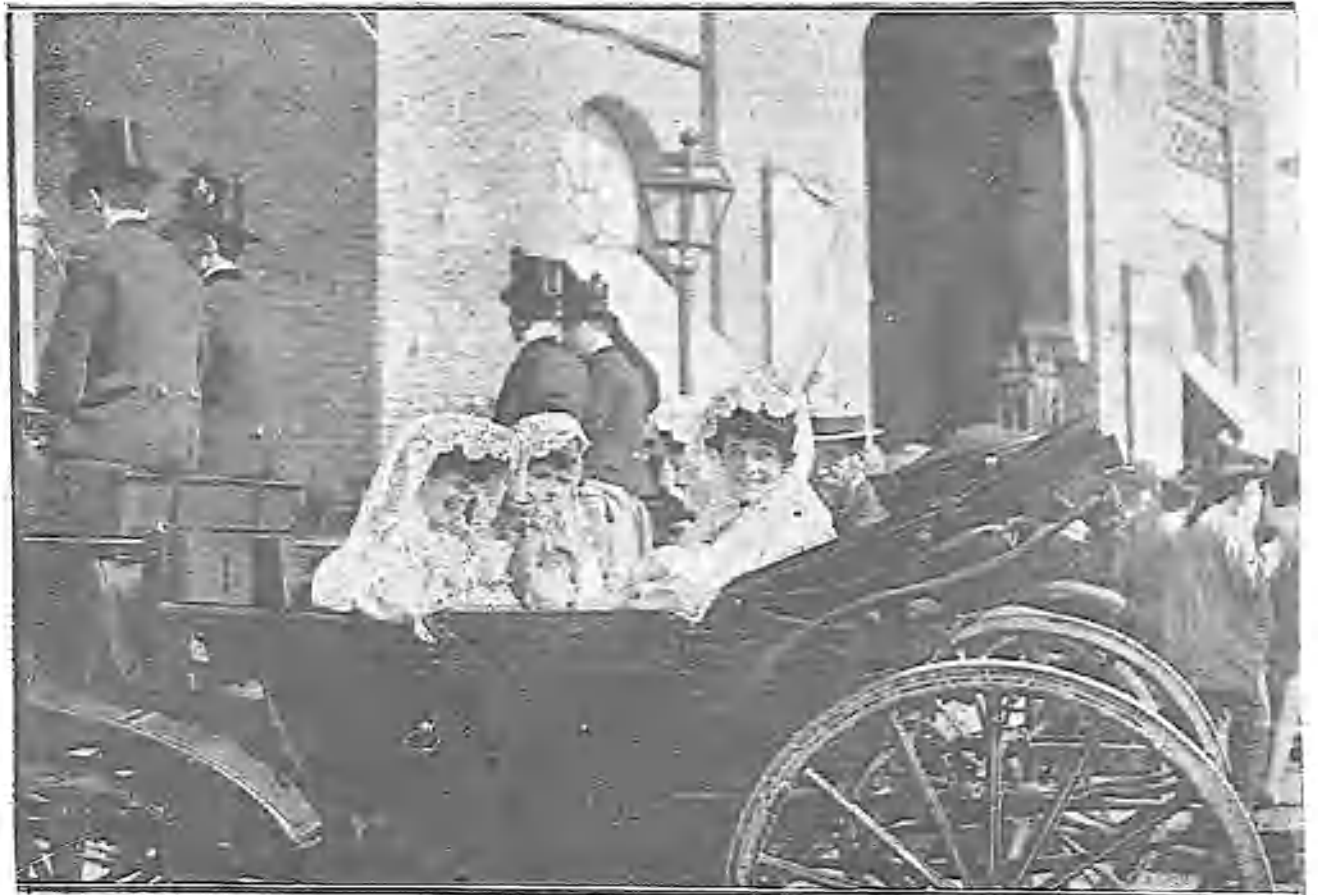
CAMINO DE LA PLAZA

Las capas pluviales de los oficiantes muestran la brillantez de su tejido de sedas y oro, y so-