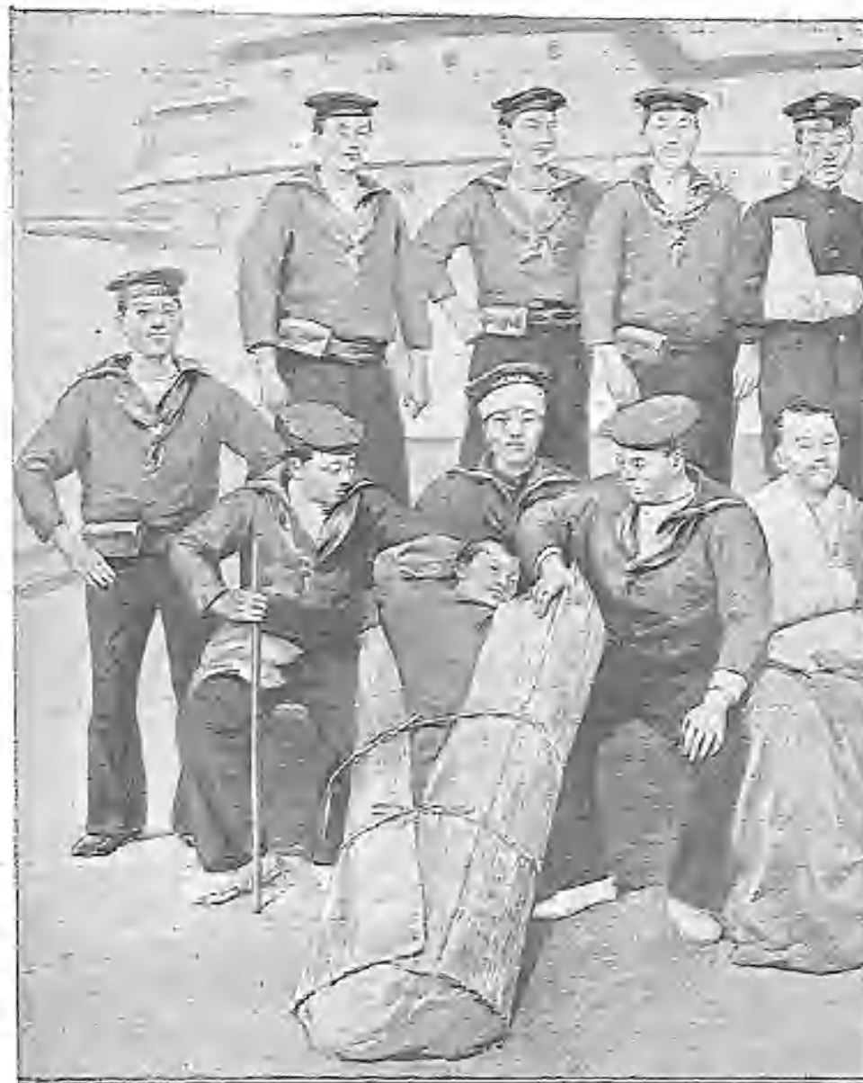
UN MARINERO JAPONÉS, GRAVEMENTE PERDIDO, SE HACE LONDUCCIA SOBRE CUBIERTA PARA ASISTIR CON SUS COMPAÑEROS Á UN COMBATE CON LOS RUSOS

ni Unamun; su Nicodemu , ni Baroja su Caminó de perfección ...»