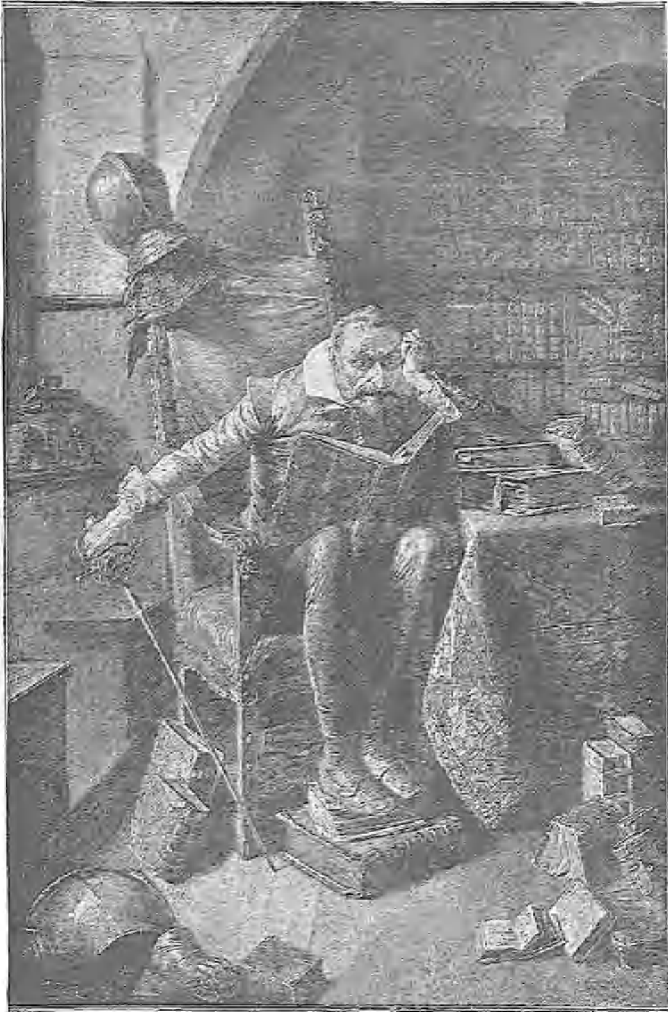
EL INGENIOSO HIDALGO PREPARANDO SU PRIMERA SALIDA (CUADRO DE EDUARD GRÜNSNER, PUBLICADO EN LA ILUSTRACIÓN ALEMANA.)

lemnes y arcaicas, y con su resplandor metálico y sus evocaciones obsoletas traen al pensamiento con precisión, netamente, el recuerdo de aquella capa pluvial áurea, diamantina, que el Greco pusiera sobre los hombros del santo obispo de Hipona cuando sostiene en sus manos los despojos mortales del conde de Orgaz, ante el severo concurso de caballeros, entre el ondulante y torturado llamear de los cirios.