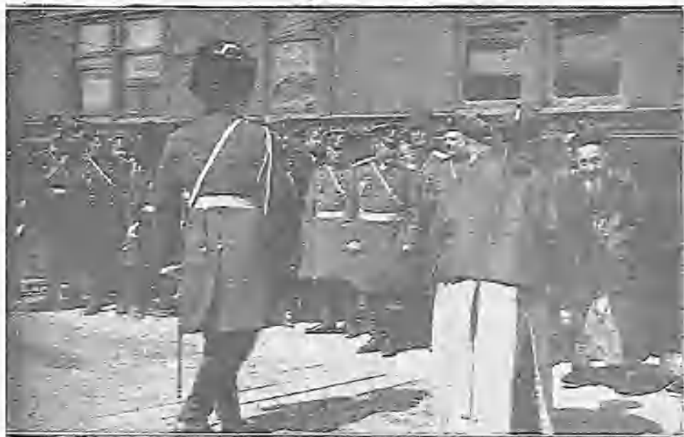
EL GENERAL KUROPATKINE ANTE UNA MISION CHINA EN EL CAMINO DE LA MANDCHORIA

Y los transeúntes se detienen por centenares á contemplar la parte que pueden del gran acontecimiento nacional.