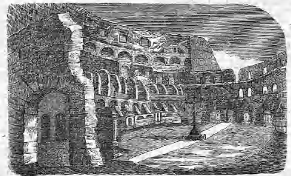
El coliseo de Roma.—Vista interior.

En la hora de medio día, y empezamos á descender. La nieve es mucho menos gruesa que á la subida. En Rochers Foudroyes nos hundimos hasta media pierna. Continuamos, sin embargo, nuestra marcha bastante aprisa, y hacia las tres llegamos á Grands-Mulets. Despedí á los guías y con-