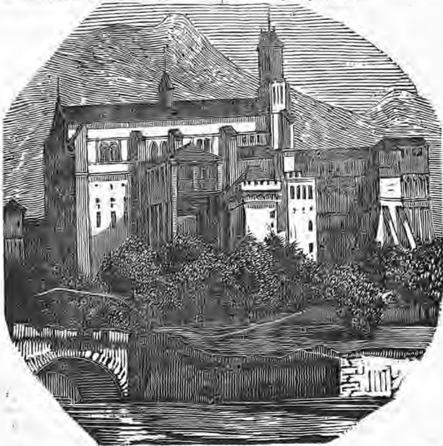
EL MONASTERIO DE VUSTE.