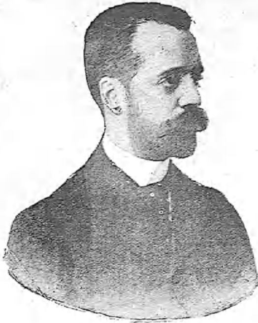
D. JOSÉ SÁNCHEZ GUERRA DISTINGUIDO PERIODISTA Y EX SUBSECRETARIO DEL MINISTERIO DE ULTRAMAR

Hace algunos años podría haberse dicho del ex subsecretario de Ultramar que iba á tener un porvenir brillante.