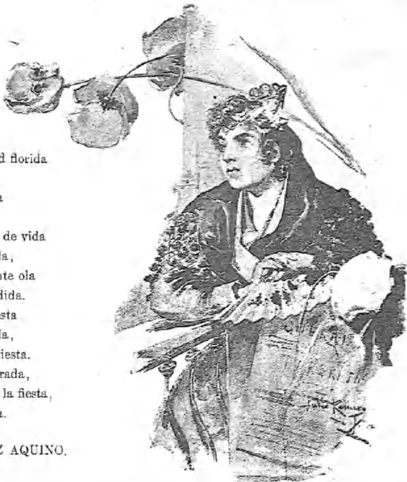
(Ilustración de J. Romero de Torres.)