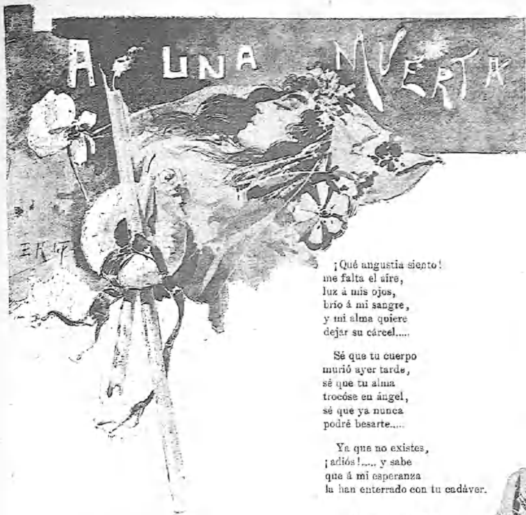
Ilustración de E. Romero de Torres.