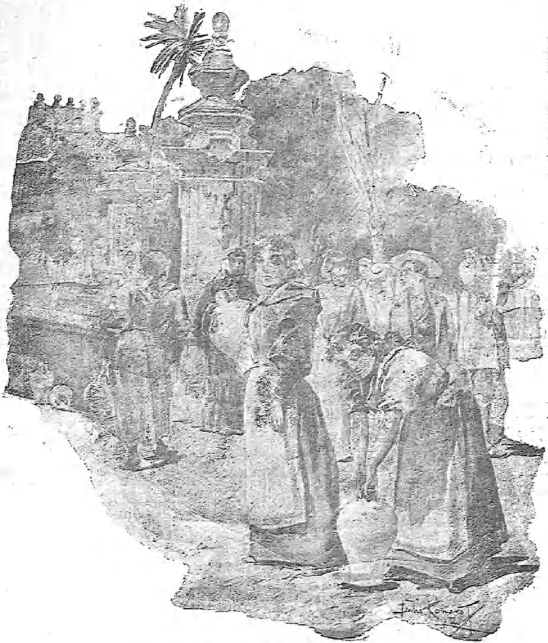
EL PATIO DE LOS NARANJOS DE CÓRDOBA

Composición y dibujo de J. Romero de Torres