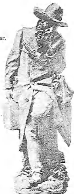
AL PARDO ESCULTURA DE ALCOVERRO