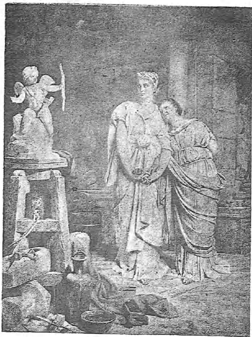
CUADRO DE A. DE COURPEN