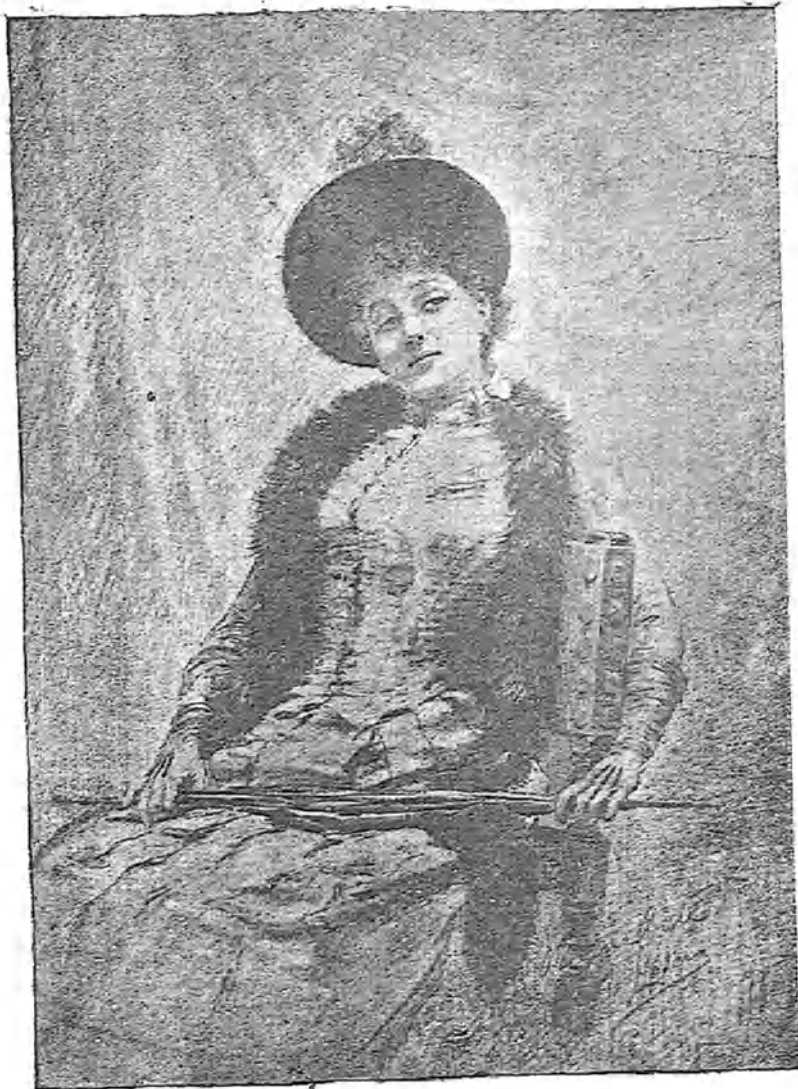
EL DESCANSO.—DIBUJO DE LLOVERA