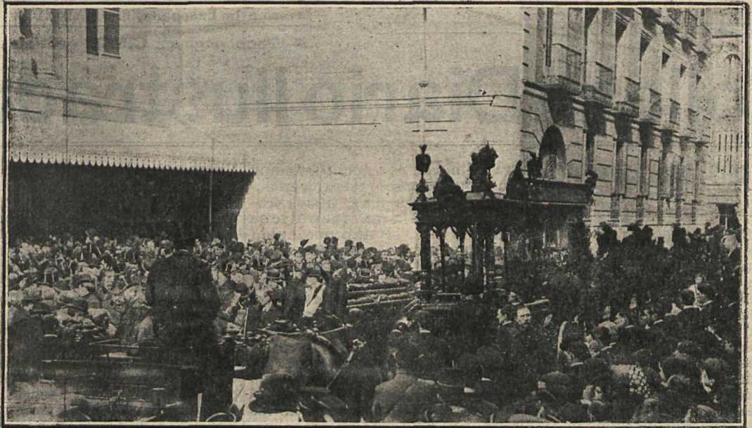
La comitiva fúnebre partiendo del teatro de la Zarzuela.