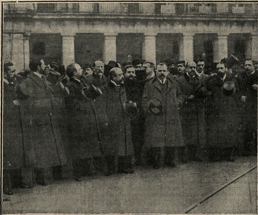
La presidencia del duelo.