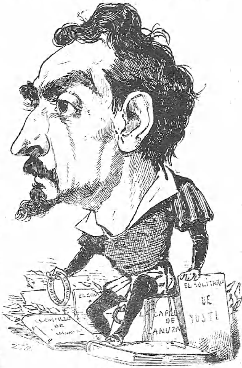
Cantaste al Justicia, y es ese tu canto de honor; porque él, era aragonés, y aragonés el cantor.