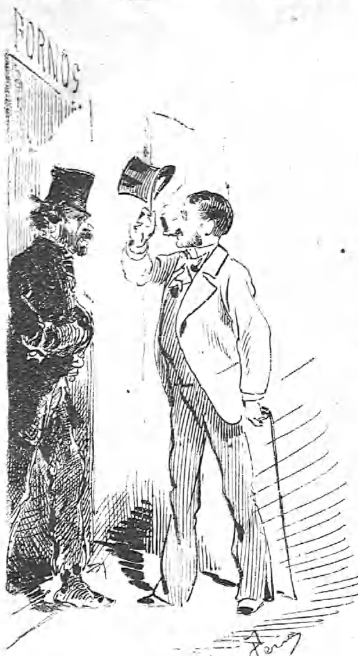
— ¡Hola! ¿Se baja de comer? — No, señor, de lo contrario.

— Er preziente fué un tal, y no amitió una discurpa.