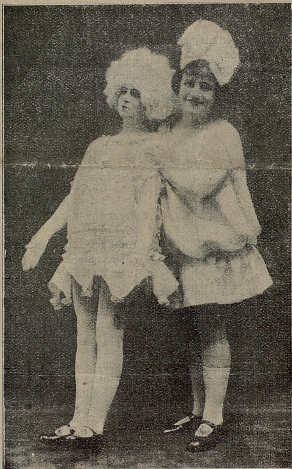
HERMANAS OBIOL «La Muñeca mecánica»