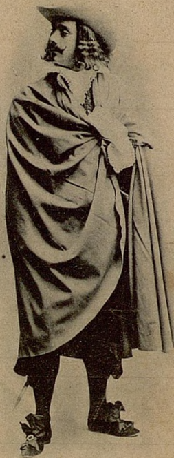
FERNANDO DIAZ DE MENDOZA