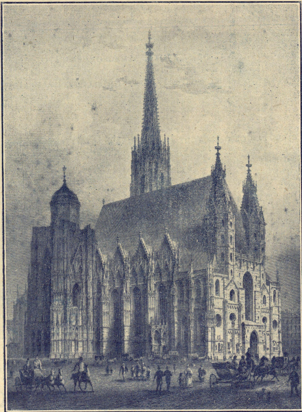
Iglesia de San Stephan