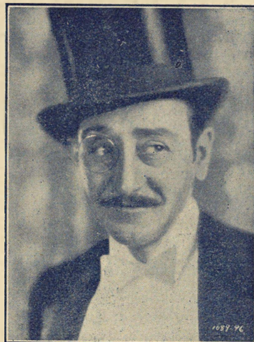
El popular artista cinematográfico Adolphe Menjou.

No nos sorprenderá leer cualquier día en el cartel del Cómico la reposi-