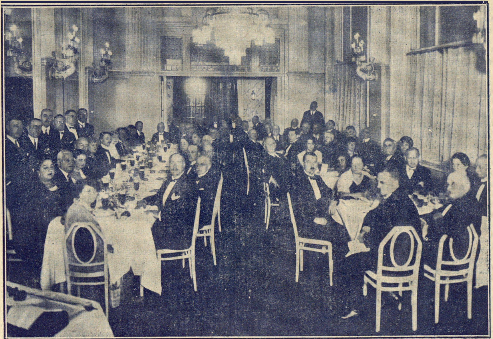
Banquete celebrado en Viena al que asistieron las representaciones de Europa y América (En primer término, de pie, la representación de España)