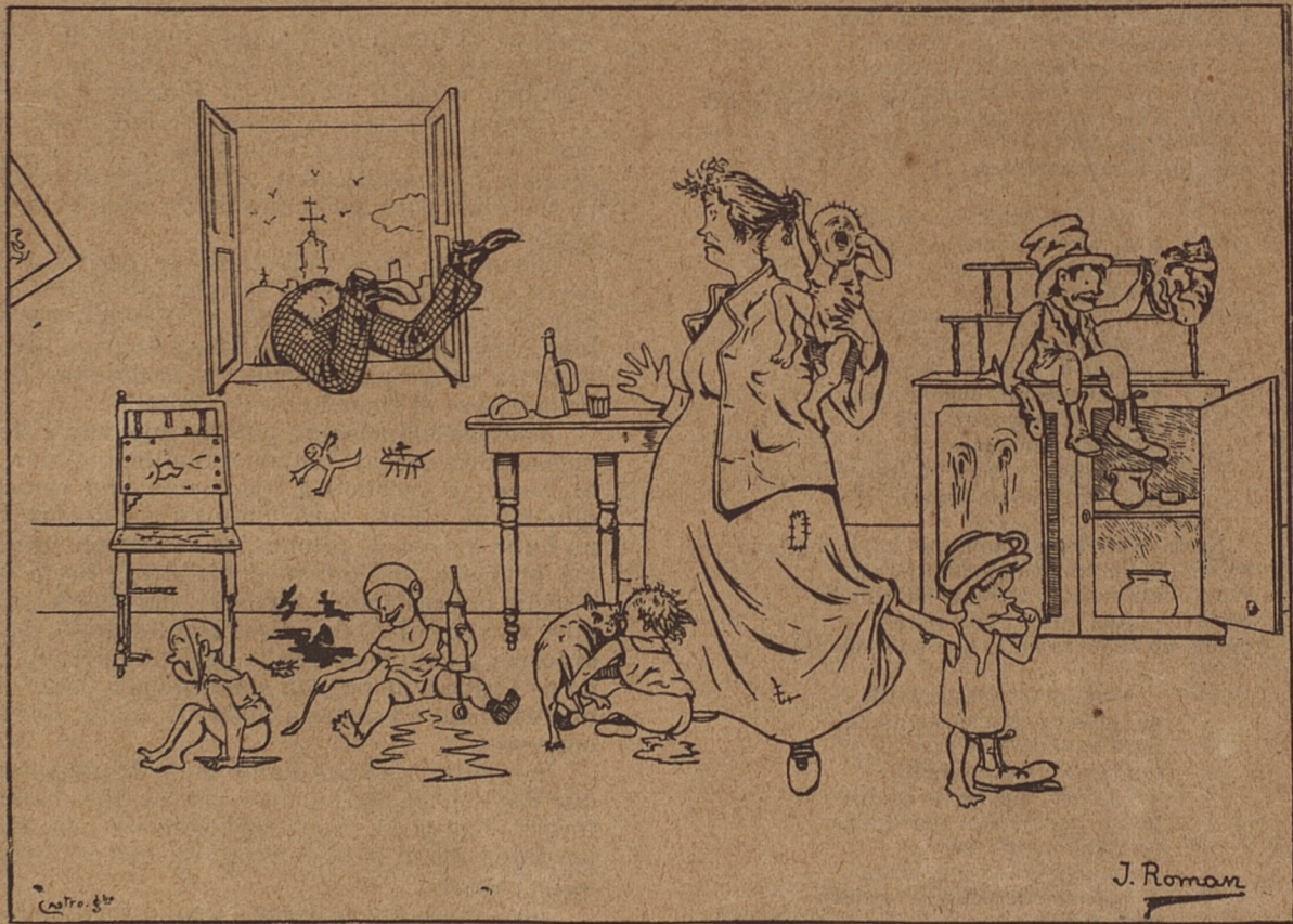
Al anunciarse el décimoséptimo.