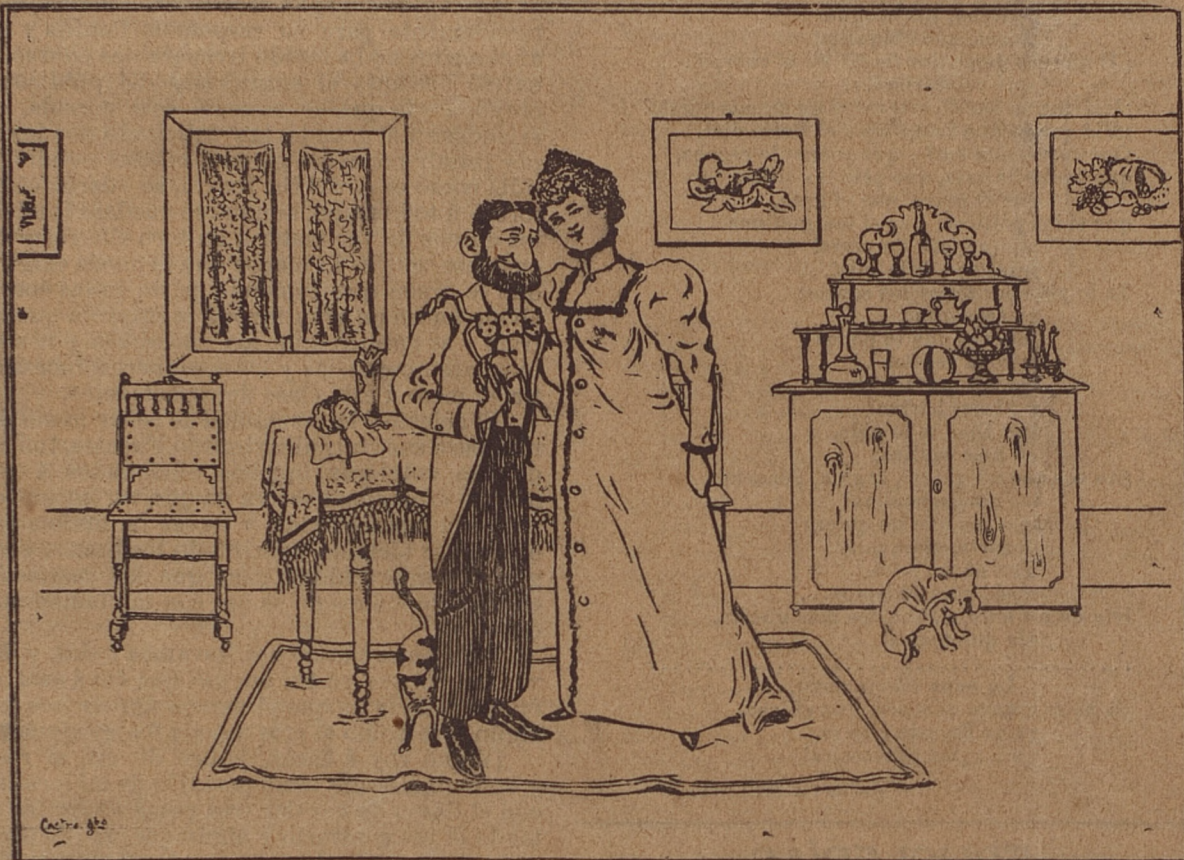
Al anuncio del primer retoño.