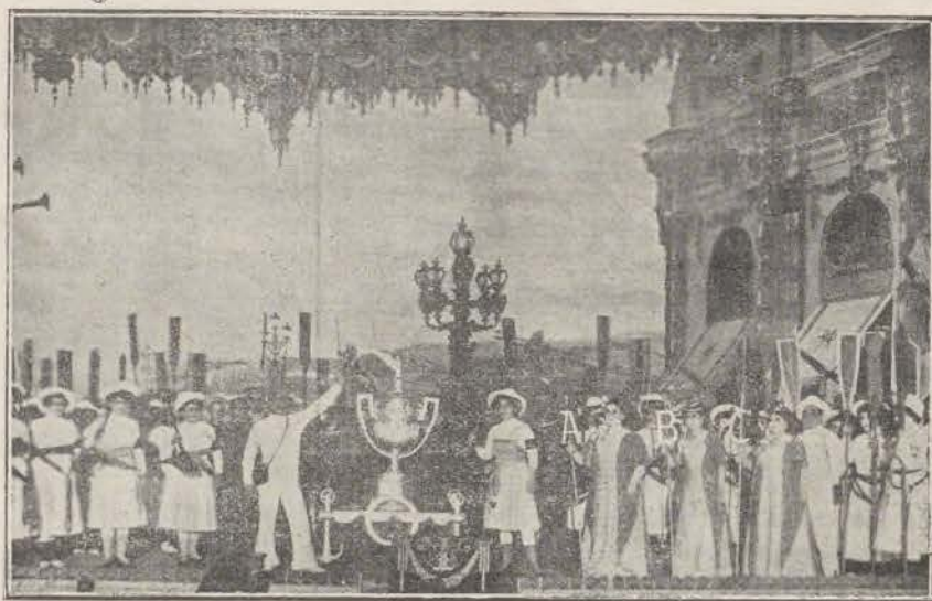
A. B. C. — Final del cuadro cuarto: Entrega del premio al vencedor en las régatas del Manzanares.

En una palabra «A. B. C.», no es más sino una exposición de pintura escenográfica y de vestuario, y esto, por sí sólo, no basta para atraer al público.