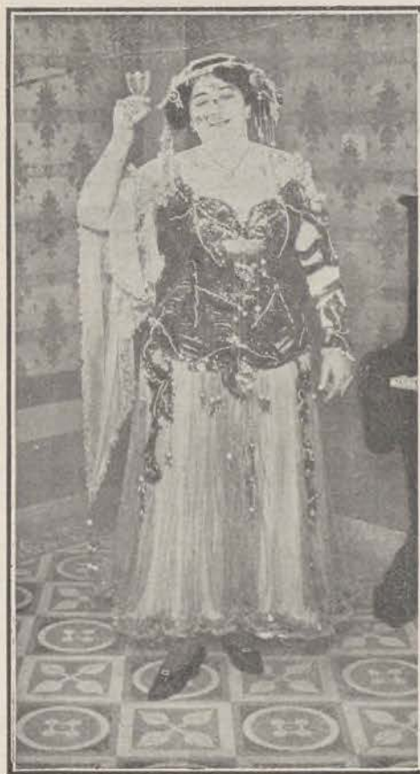
En „La Manzana de Oro“, complet de La Menta.