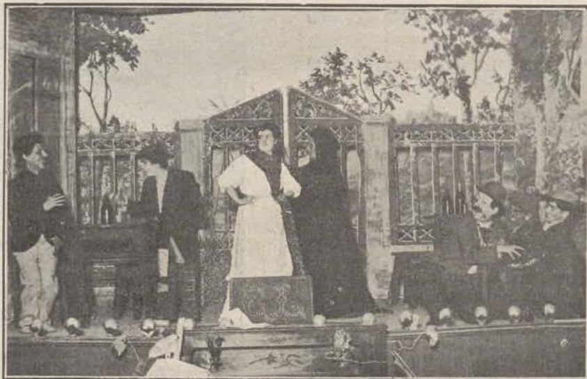
Coliseo de Lavapiés.—Última escena de «El Chico de Lavapiés».