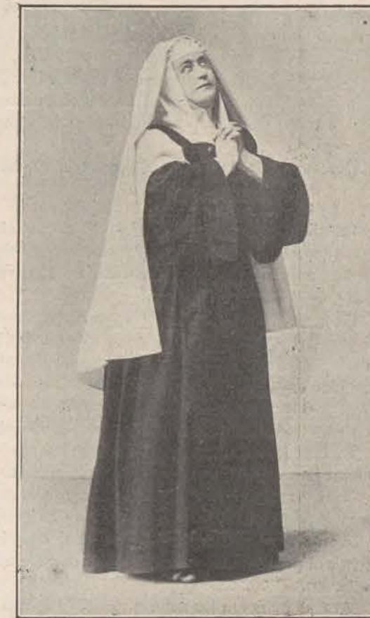
En «La Duquesa de la Valliere».

Hoy honramos nuestras páginas con varias fotografías de la eminente artista, gloria de nuestro teatro. Á rendirla tributo de fervorosa admiración van estas líneas con su modestia.