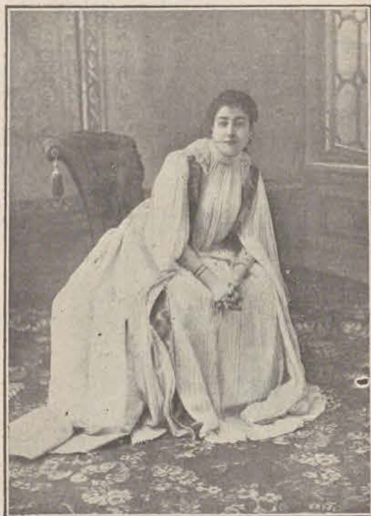
En «La dama de las camelias».