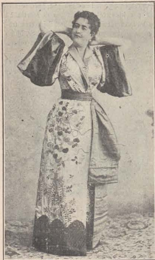
En «La extranjera».