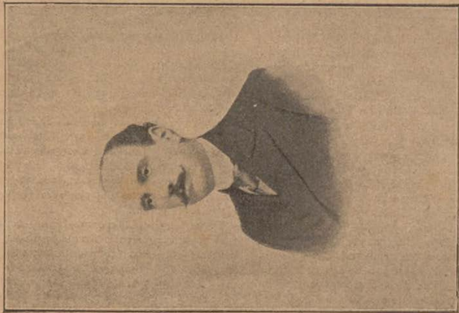
EXCMO. SR. D. EDUARDO DATO IRADIER