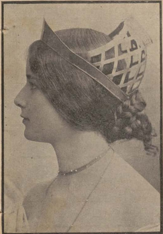
CLEO DE MERODE