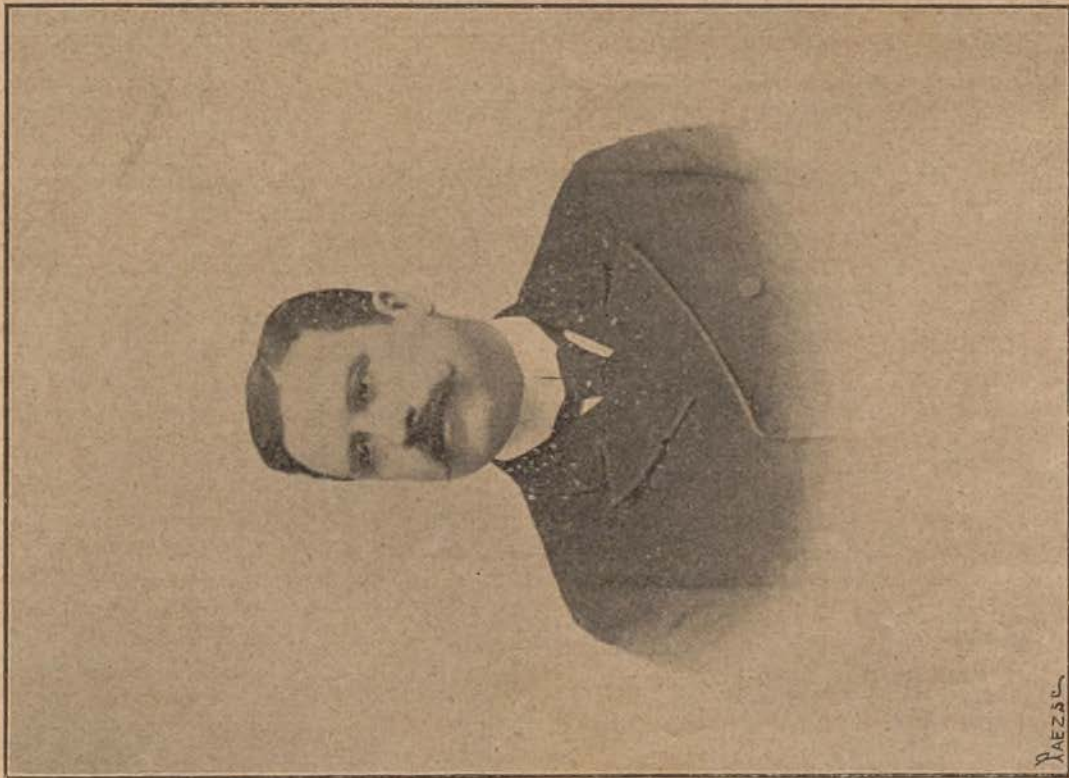
EXCMO. SR. D. RAIMUNDO FERNANDEZ VILLAVERDE