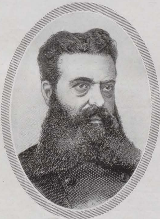
Don Antonio Dorregaray, jefe de E. M. del ejército carlista en las operaciones sobre Bilbao.

Hubo un momento en que Cantabria, aunque diezmado, en un supremo esfuerzo, trepando, abriéndose paso entre breñas, piedras enormes