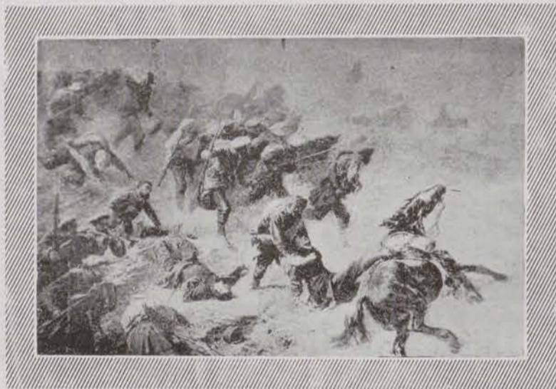
Infantería carlista cargando a la bayoneta.

deno, sombrío, pletórico de nubes. La batalla toca a su fin; los soldados de la libertad, extenuados, no pueden más; han llegado al último extremo de las fuerzas humanas. Por su parte, los carlistas, rendidos por ocho horas constantes de pelea, han agotado sus reservas y sus municiones; un nuevo ataque no lo hubieran podido resistir.