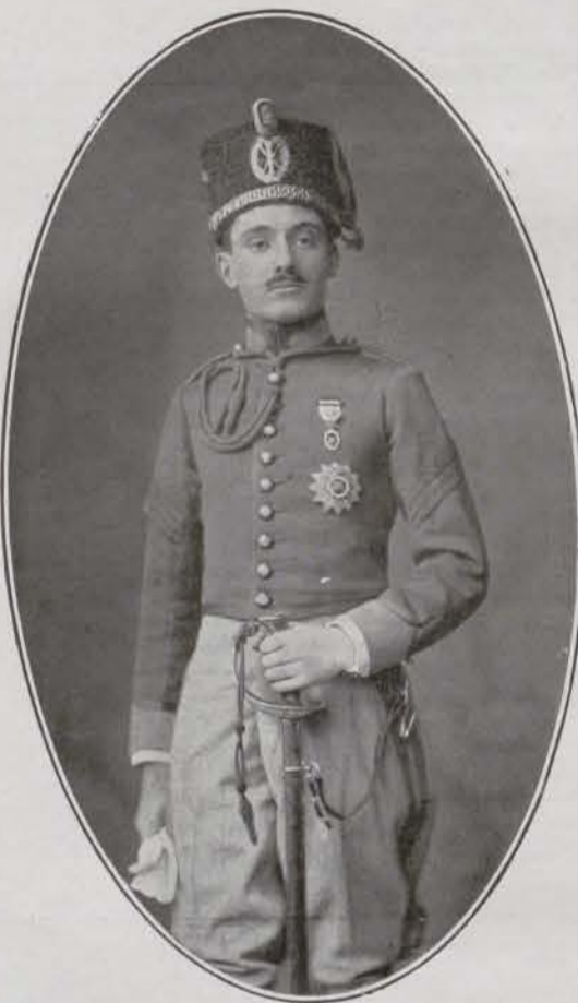
El Duque de Almenara Alta, que se ha cruzado recientemente Caballero de Santiago.

En su palco habitual, la Duquesa de Fernán