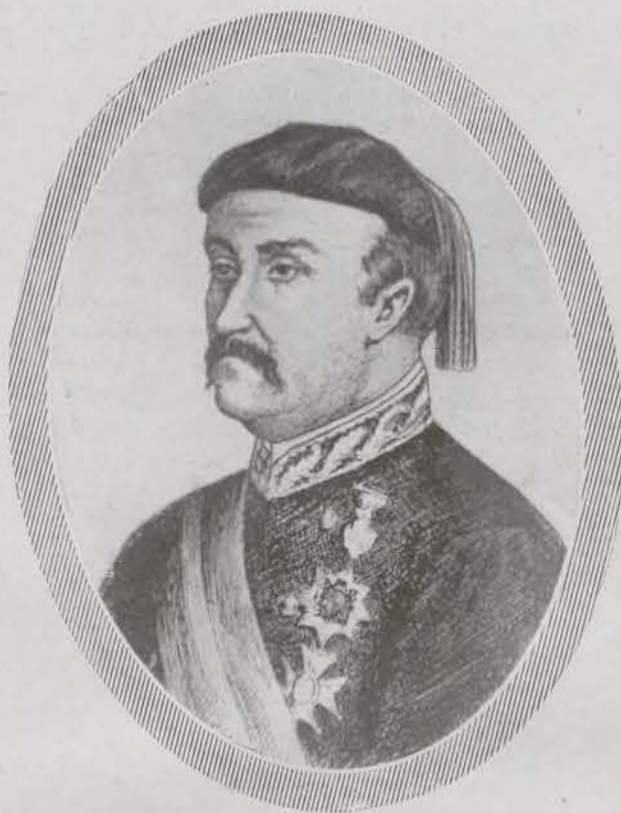
Don Nicolás Ollo, General en Jefe del ejército carlista en las líneas del Somorrostro.

El sol descendiendo, la tarde acaba, y el firmamento, antes sereno y espléndido de luz, ahora se torna cár-