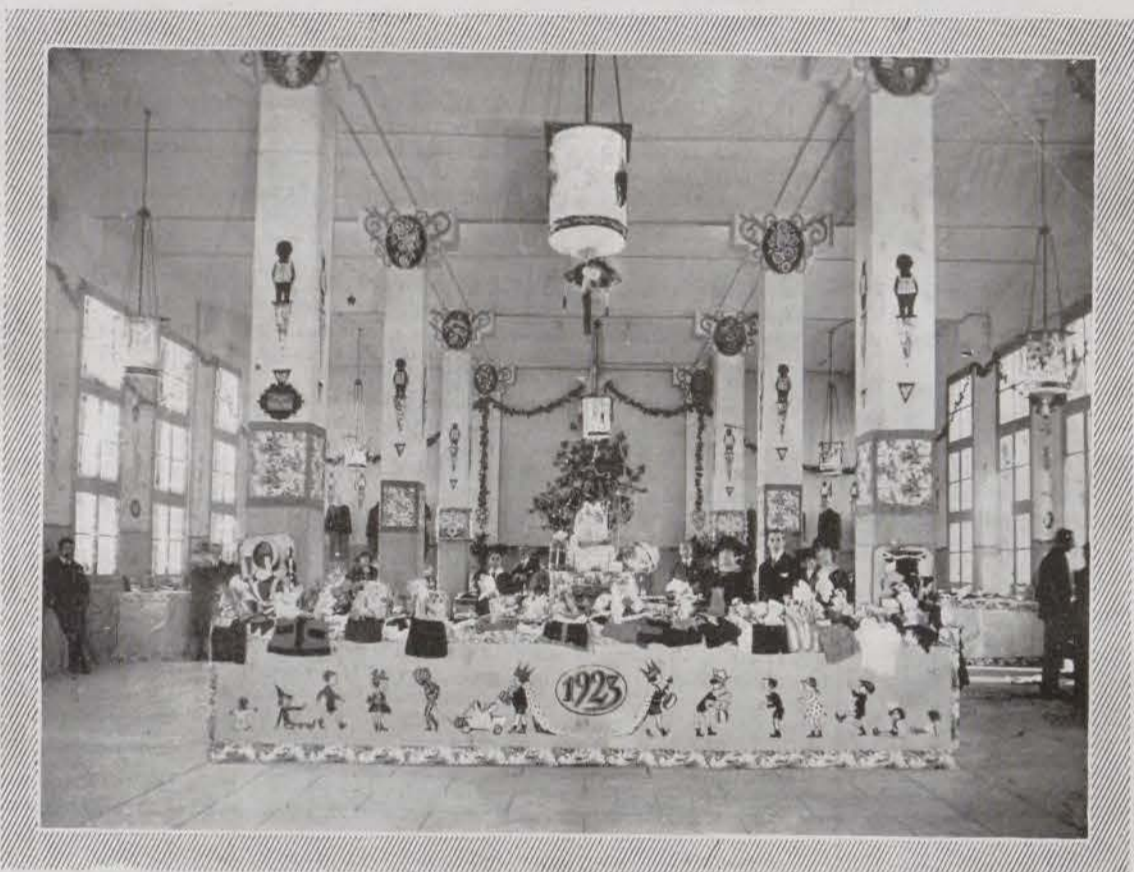
Uno de los salones de «Floralia» con los juguetes que habían de ser repartidos entre los hijos de los empleados y obreros de la casa.

Sobre este ejemplo y sobre tales resultados es conveniente y beneficioso meditar.