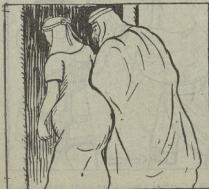
III.—Y quedó cumplida la orden, y S. M. pasó con la subdita á sus habitaciones.

—El pecado de que te acusas... ó, mejor dicho, de que te acuso yo, asintiendo tú con el silencio, es de los más difíciles de perdonar. Como pública es la voz que te conceptúa liviana y amiga de manosear á tus gala-