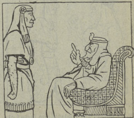
IV.—S. M. I. notó después que le faltaba el anillo insignia de su jerarquía.