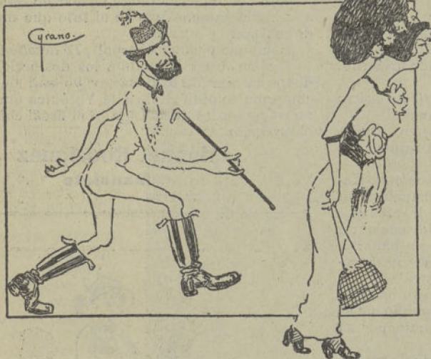
Don Dalmacio paseando con el traje que él pedía para los redactores de LA HOJA DE PARRA.—(Apunte del natural).

operaciones de banca, pueden reducirse á números. Para él, cualquier sentimiento está contenido en la fórmula algebraica: A : B :: C : X . De donde A... Etcétera, etcétera.