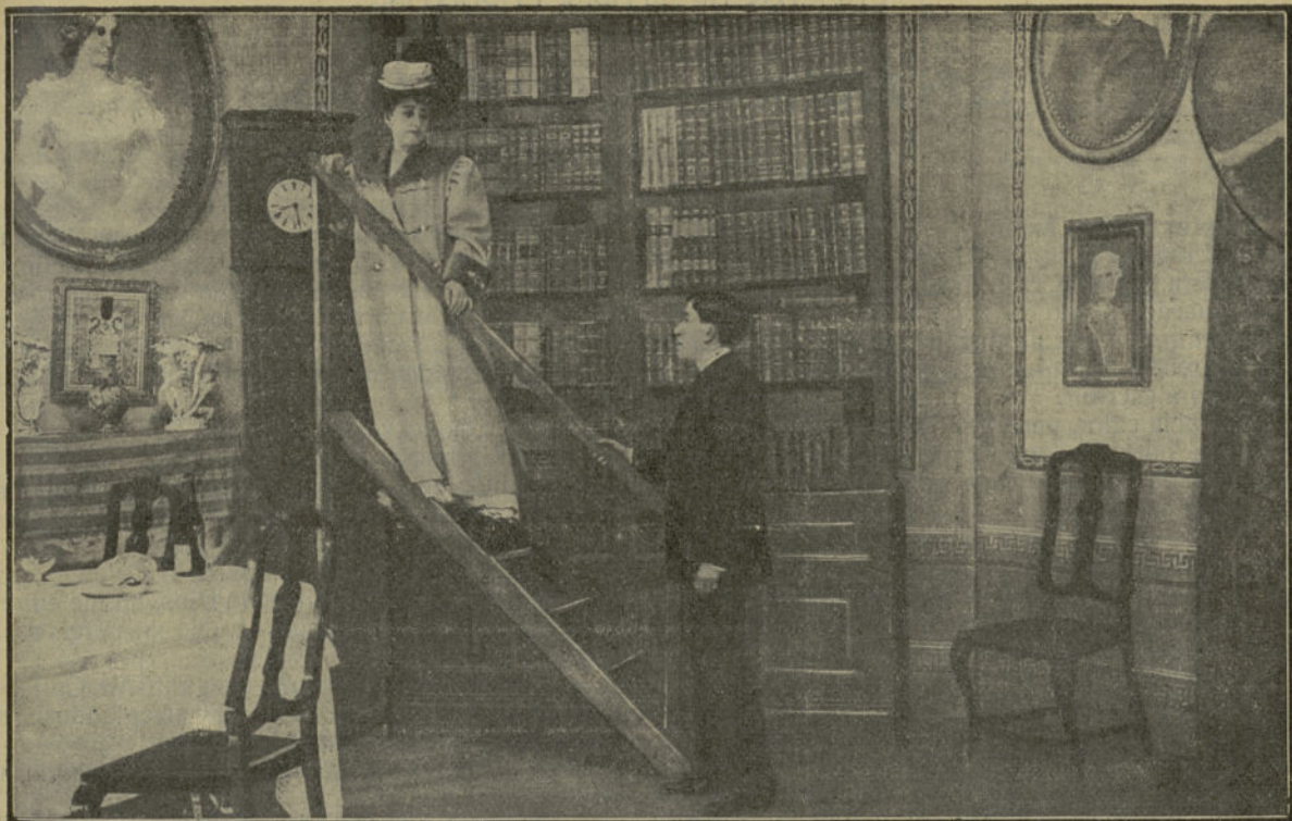
Una escena de la obra El amor vela , estrenada en el Teatro de la Comedia.