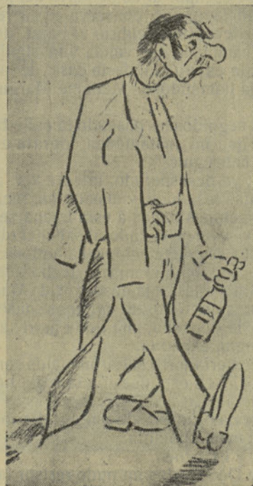
La hora del cierre.