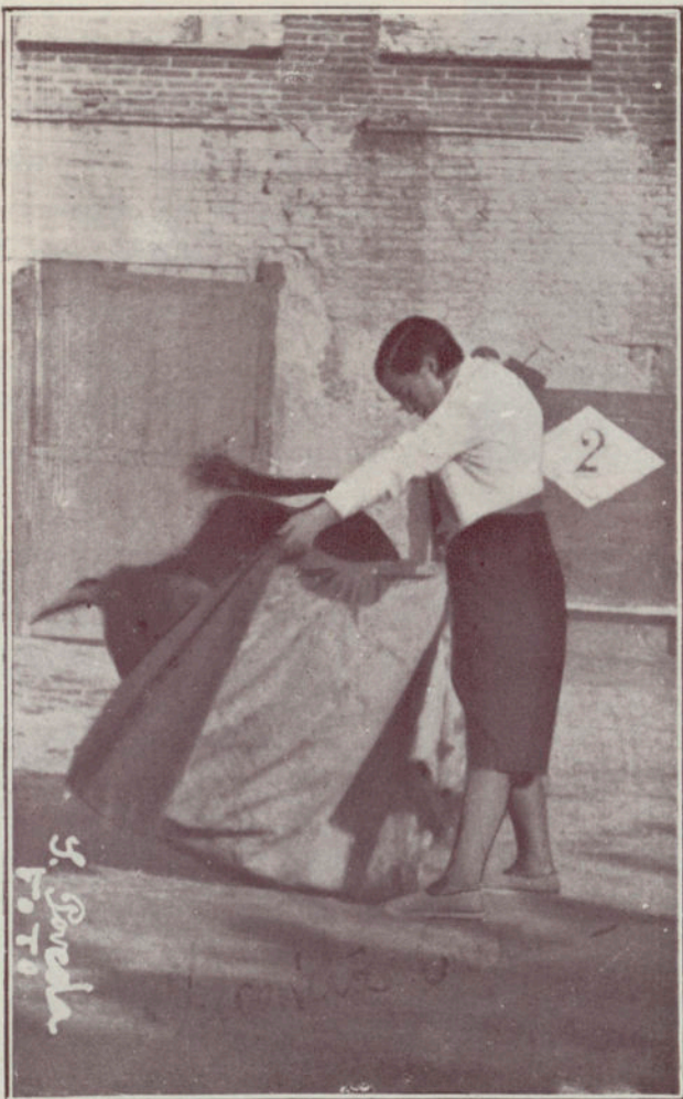
La elocuencia de esta foto es el mejor elogio de la misma.