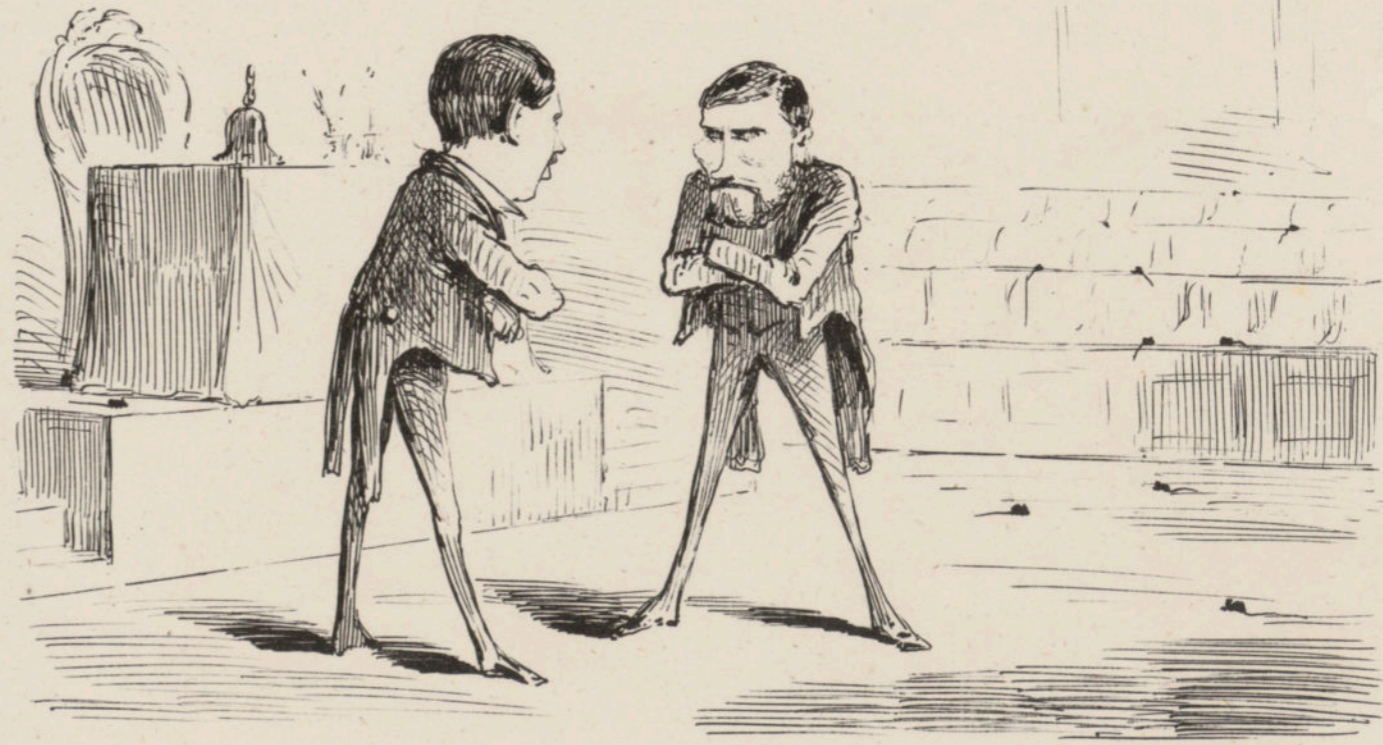
El dia de la votacion.