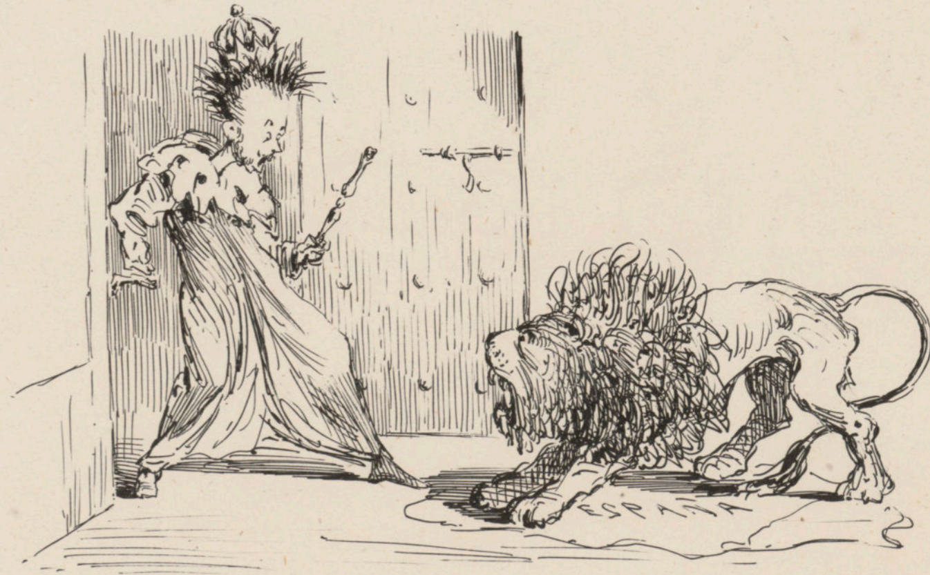
- ¡Escamati del lionii!!