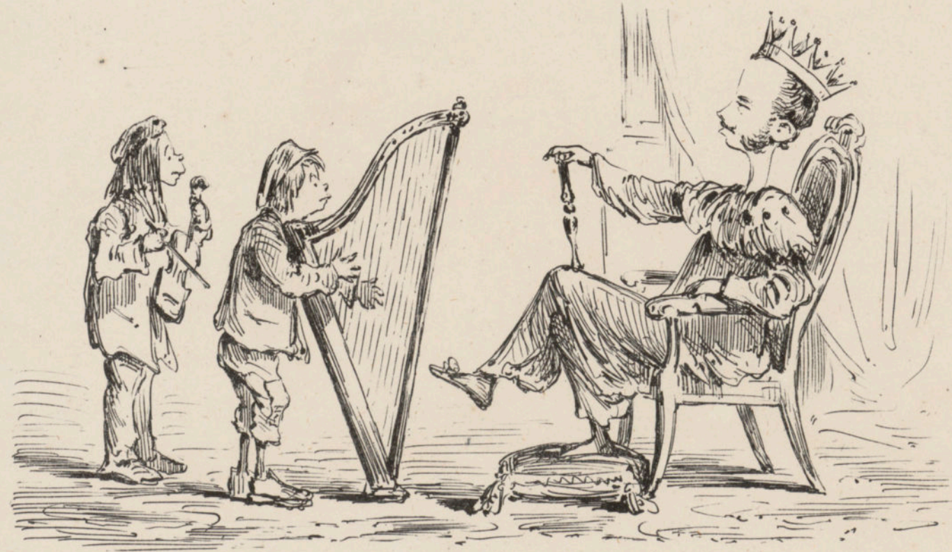
Las únicas felicitaciones posibles.