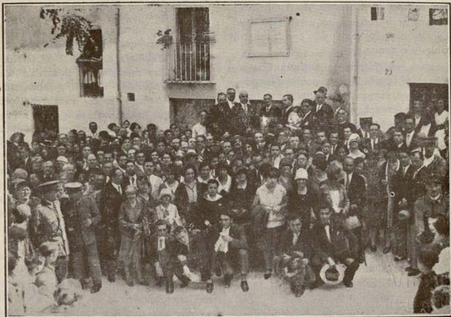
Los congresistas ante la casa de Martí después de descubierta la lápida.

con voz llena de emoción, que transmitió a los oyentes las vibraciones de su hondo sentir, hizo, brevemente, la oferta de este recuerdo, con las frases elocuentes que copiamos a continuación: