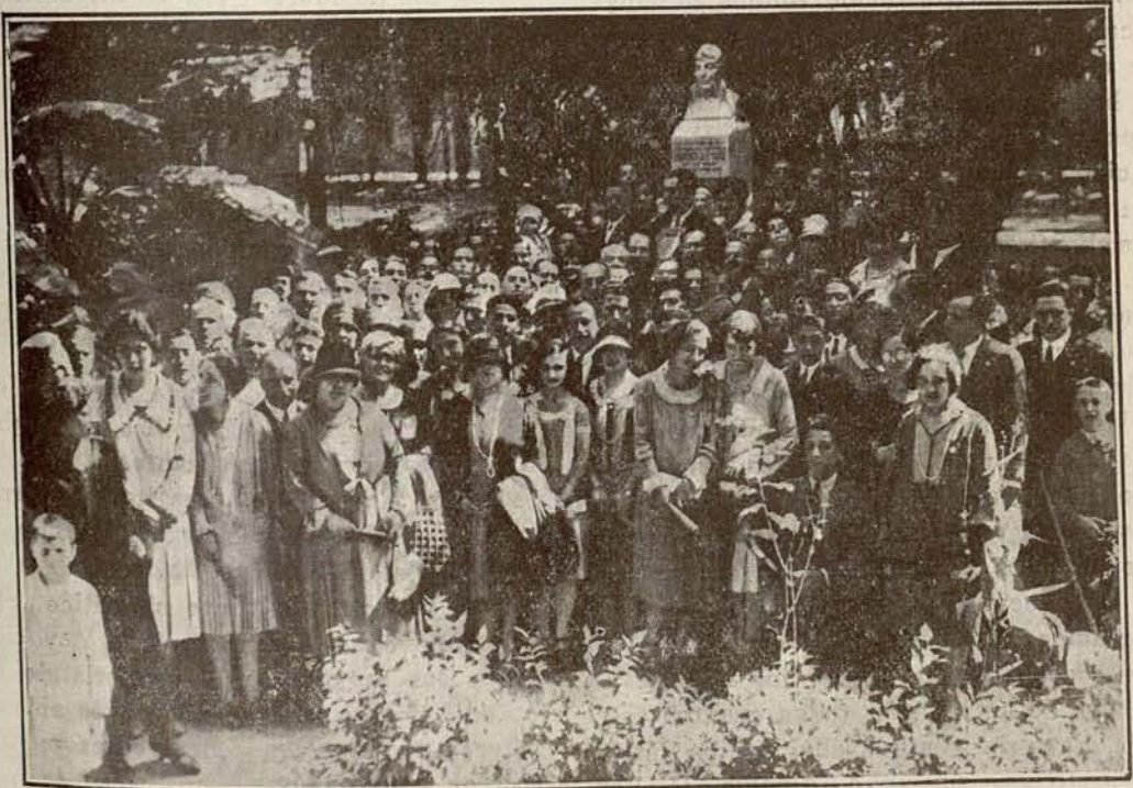
Aspecto de la glorieta después de descubierto el monumento.