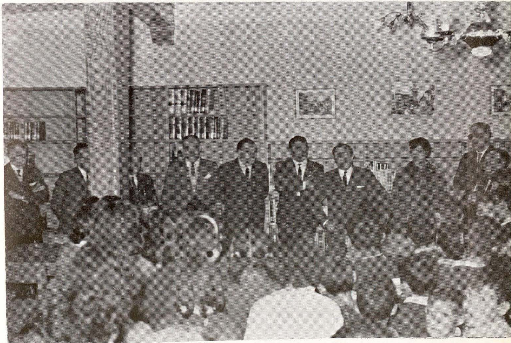
Vista de la Biblioteca Municipal de Navacerrada, en la foto superior, y el acto inaugural de la Biblioteca de Robledo de Chavela.