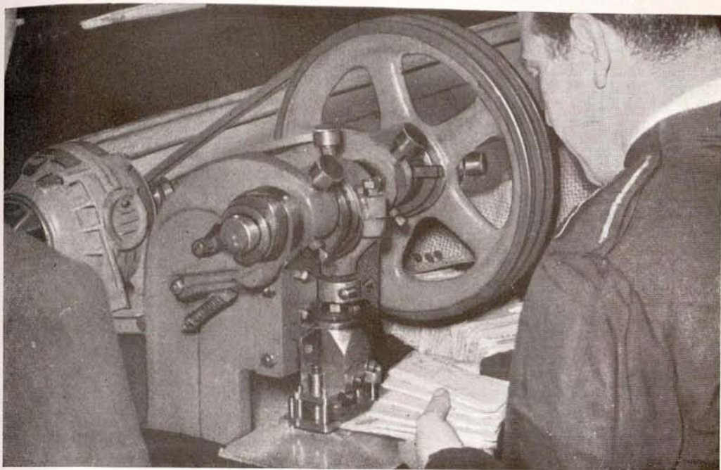
APUESTAS MUTUAS. —Máquina perforadora de las que se emplean para imposibilitar la clasificación fraudulenta de los boletos.