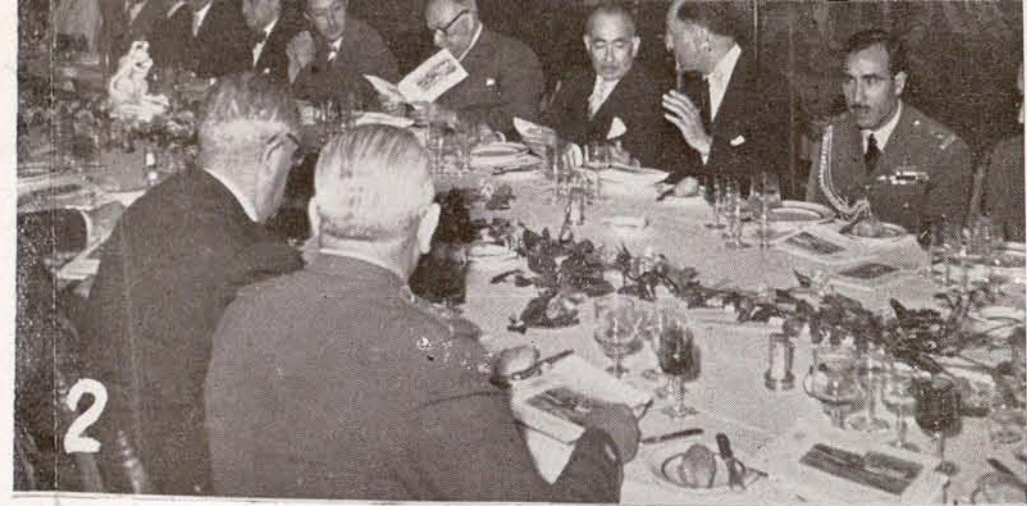
La Diputación Provincial obsequia al Regente de Irak con un almuerzo en el Hotel Felipe II, en El Escorial.