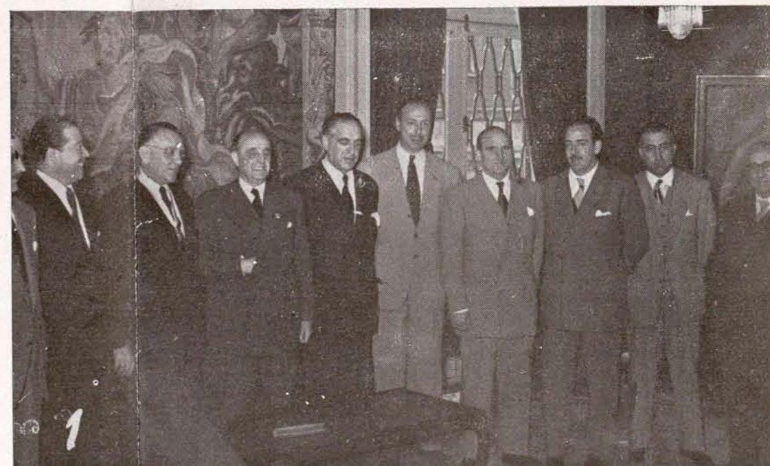
El Marqués de Pelayo es condecorado por el Presidente de la Diputación con la Medalla de Plata de la Provincia.