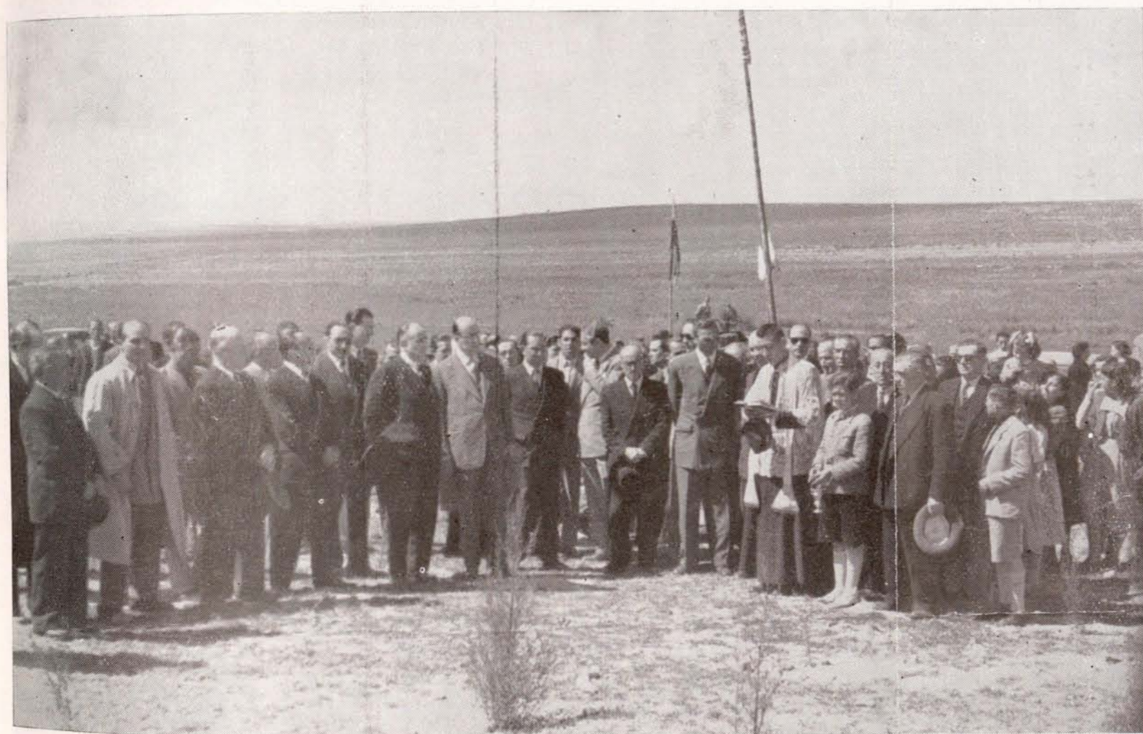
Durante el 1952 se continuó la creación de cotos forestales, que tan beneficiosamente han de repercutir en la economía de la provincia. En este grabado, las autoridades provinciales inauguran un nuevo coto.