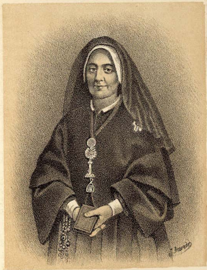
LA SEÑORITA DE BALLESTEROS, EN EL CLAUSTRO M TE . CARIDAD.