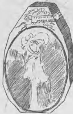
87.—RETRATO DE LA SRTA. M. M., de Benedito.

El único que trató de deshacerla fué el Ministro, que ni siquiera en una ocasión así se permitió dejarse la oratoria en casa.