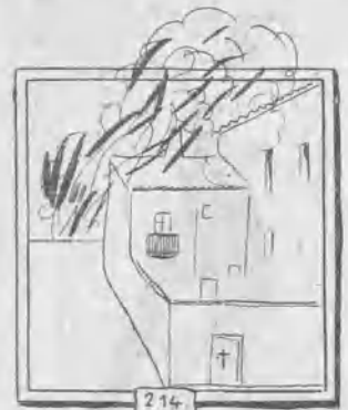
LA CASA MUERTA

Nosotros vamos á hablar de la Exposición lo mismo que hablamos de la política de Maura y de la literatura de Azorín: en chirigota.