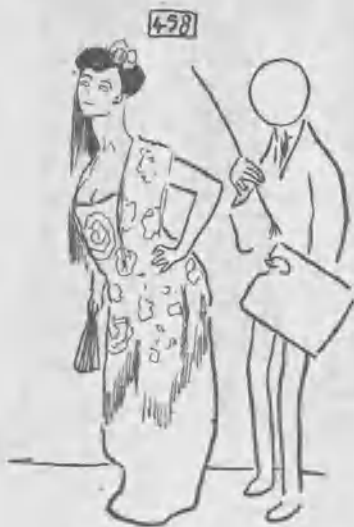
455.—MODELO Y PINTOR, de López Mezquita.

Allendesalazar, Requiebro , Benavente, Los novios .