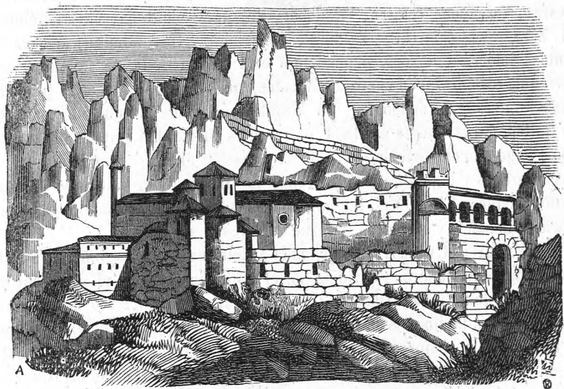
Monasterio de San Prudencio en Logroño.

NÁJERA: Ciudad situada á cinco leguas de Logroño, al pié de una cordillera y bañada por el rio Najerilla. Es de antigua fundacion, y en el monasterio de Santa María la Real están sepultados 35 reyes y personas reales de Navarra y Castilla: fué córte de los reyes del primer reino. Consta de 604 vecinos y 2,746 habitantes. Corresponde á la diócesis de Búrgos, y partido judicial de su nombre, que es de entrada , y comprende los 45 pueblos de Alesanco, Aleson, Anquiano y Villanueva, Arenzana de Abajo, Arenzana de Arriba, Azofra, Badarán, Baños de Riotovia, Berceo, Bezares, Bobadilla, Brieba, Camprovin, Canales, Canillas, Cañas, Cárdenas, Castroviejo, Cordovin, Estollo, Hormilla, Hormilleja, Huércanos, Ledesma, Mahave, Manjarrés, Mansilla, Matute, Nájera con Somalo y Villarrica, Pedroso, Rio, San Andrés del Valle de San Millan, San Millan de la Cogulla, Santa Coloma, Tovia, Torrecilla sobre Alesan-