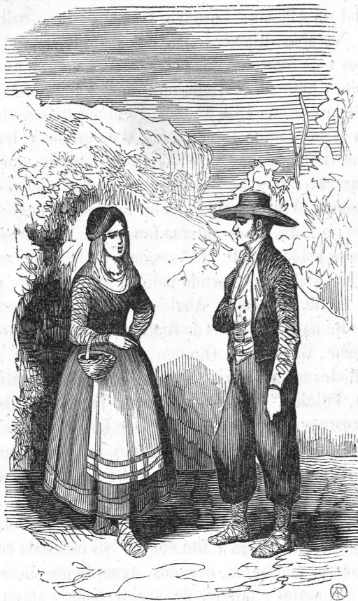
Trages de Alfaro.

bien en ella Pedro García Carrero, doctor de medicina, célebre profesor de ella en Alcalá y médico de Felipe III. En esta ciudad fué proclamado el rey don Enrique II en el año de 1366. Consta de 1,390 vecinos y 5,820 habitantes. Corresponde á la diócesis y partido judicial de su nombre, que es de ascenso , y comprende los seis pueblos de Alcanadre, Ausejo, Autol, Calahorra, y Pradejón. Hay una catedral, un cabildo con su obispo, ocho dignidades, veinte y cuatro canongías, seis raciones, doce medias, y el suficiente número de capellanes, tie-