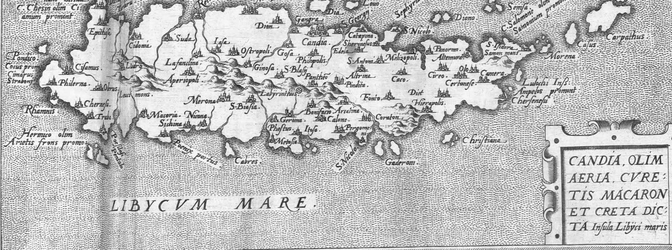
CANDIA, OLIM AERIA, CVRENTIS MACARON ET Creta dicitur Insvla Libyci maris