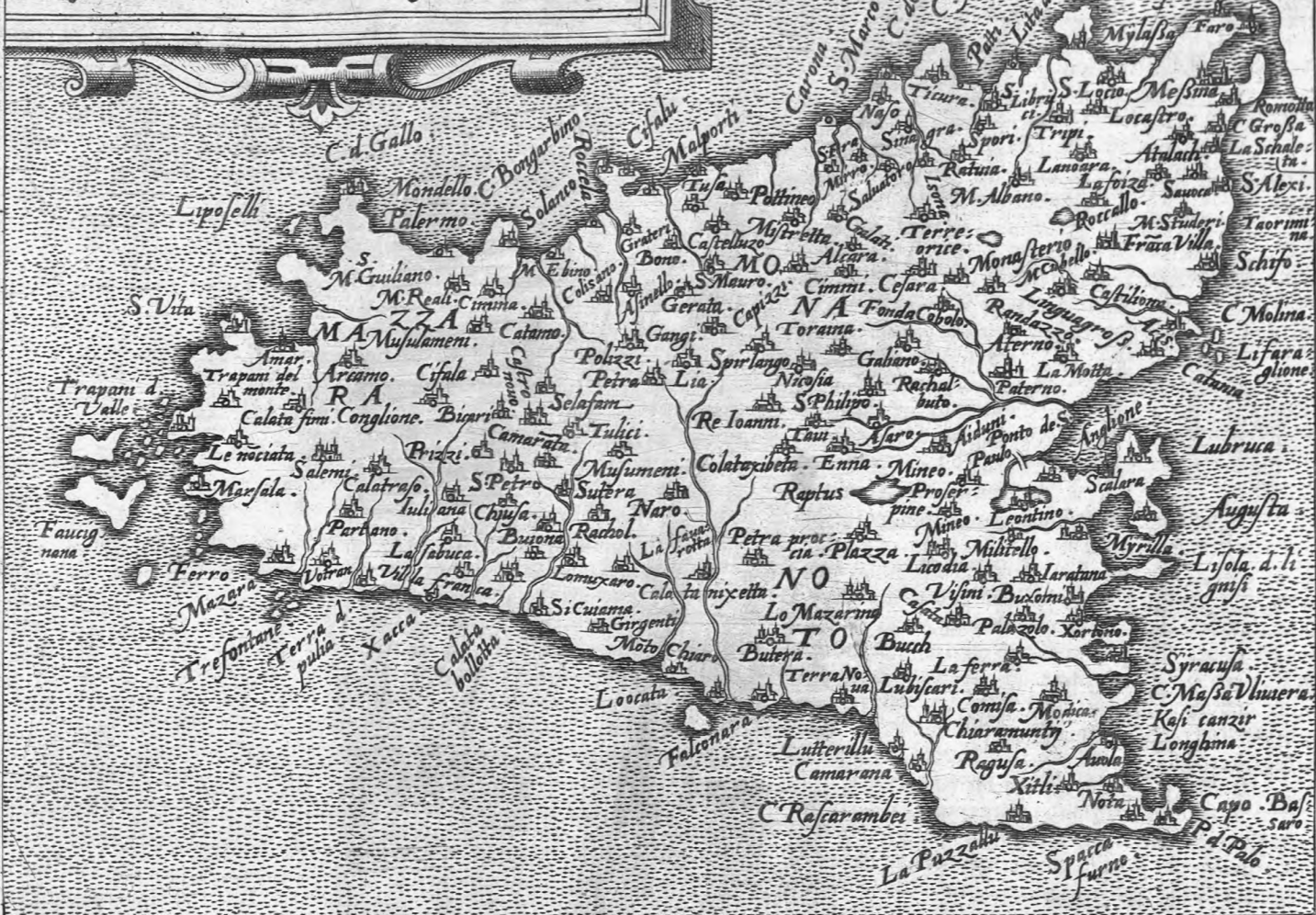
SICILIA INSVLA MARIS Inferi. iuxta Mamertinum fretum.