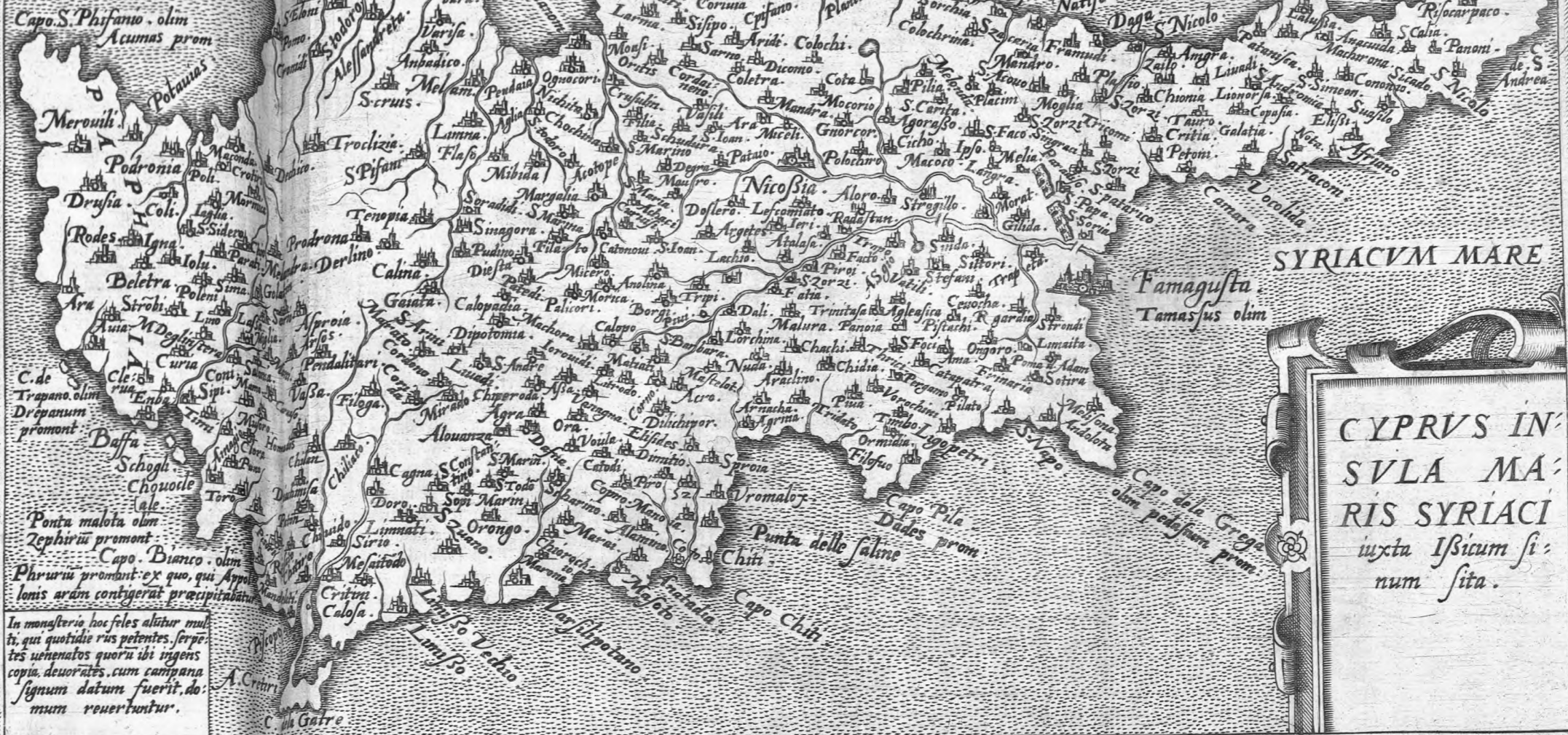
CYPRVS INSVLA MARIS SYRIACI iuxta Ibsicum sinum sita.