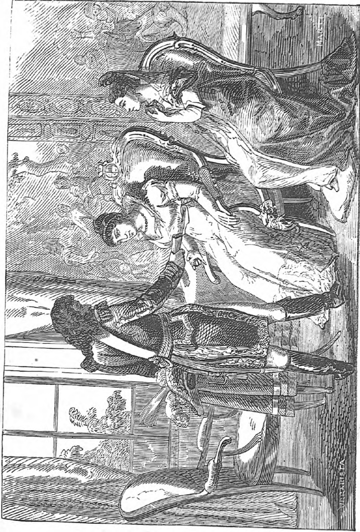
—En ese caso, señora, —repuso Murat, —dígnese V. M. dar al rey este borrador.