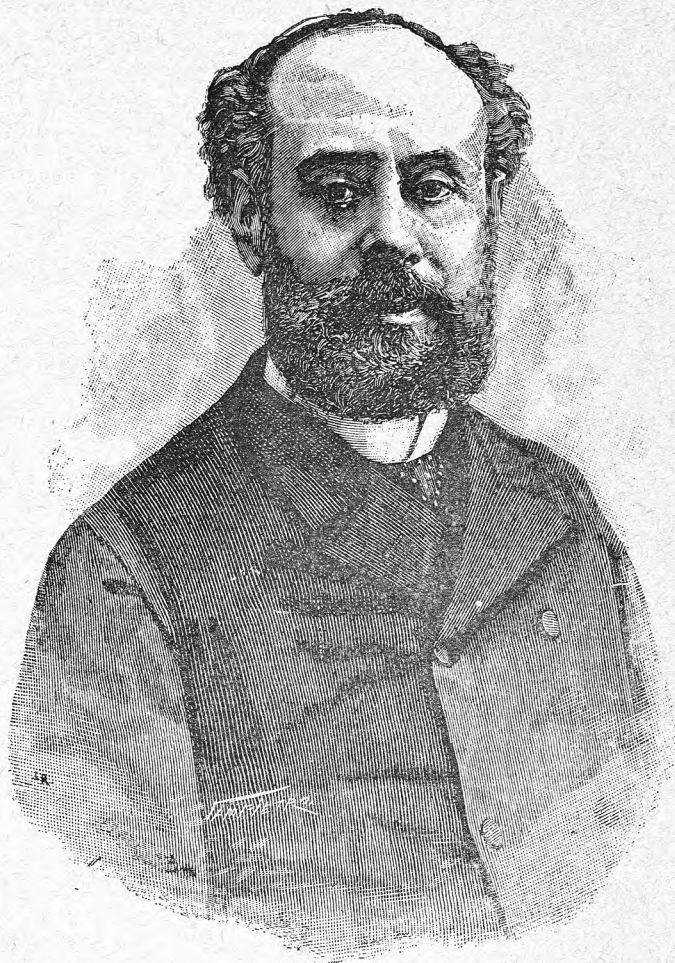
D. MARIANO SABAS MUNIESA.

Centinela avanzado de los intereses mercantiles de nuestro país, su palabra elocuente, su pluma brillante y su actividad grande, en una palabra, sus facultades todas, están prontas siempre á salir en defensa de aquéllos, siendo su nombre ilustre uno de los más importantes en la esfera de los intereses mercantiles.