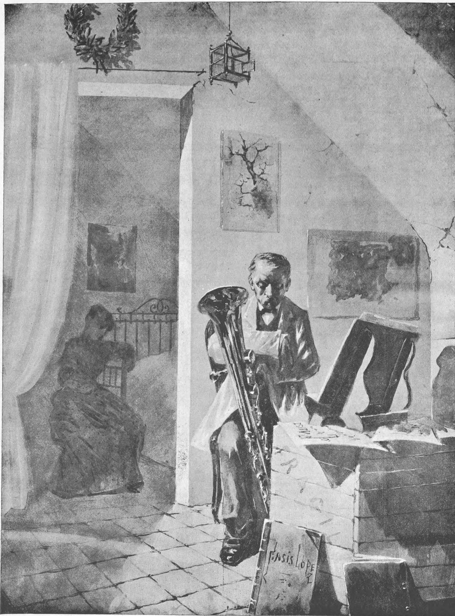
ENTRE DOS DEBERES, por Francisco de Asis LOPEZ

Si los hombres despus de su nacimiento han de ser buenos, la guerra de que se despusen para la guerra del mal a sus mismos, la misma de paraitran del mundo.