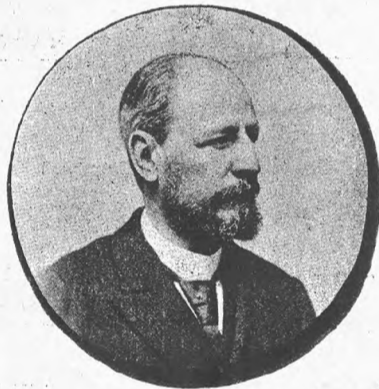
Excmo. Sr. D. Nilo María Fabra.

¡Y quiera Dios que cada ejemplar de esta obra, se convierta en manantial de limosnas para los pobres acogidos en el Asilo de Santa Cristina!