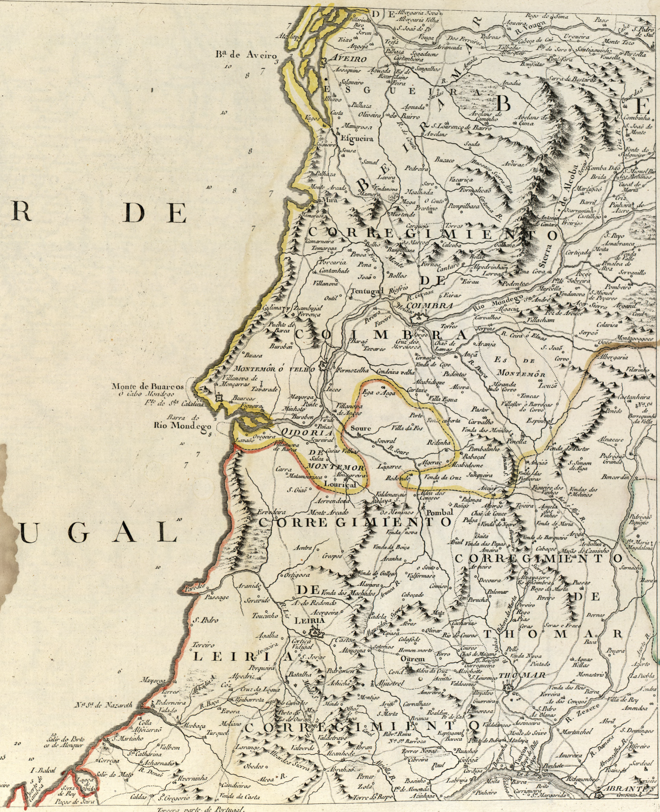
Tercera parte de Portugal.