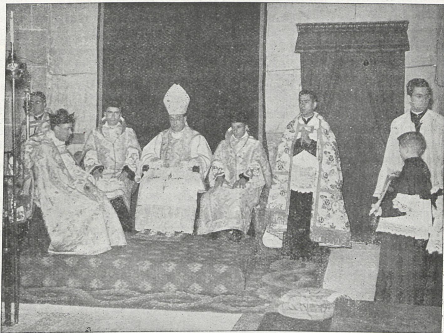
Un momento de la Misa Pontifical oficiada por el Dr. Ricote Alonso, Obispo-Auxiliar, en la Iglesia Parroquial de Colmenar Viejo, y en la que actuó con gran acierto la Schola Cantorum del Colegio Provincial de Nuestra Señora de las Mercedes.—Abajo, un aspecto parcial de la Plaza Mayor de Colmenar durante uno de los actos que se organizaron el primer «Día de la Provincia». Del éxito del mismo es una prueba más lo nutrido de la concurrencia, que sigue con interés las incidencias del festejo.—(Fotos Urech)