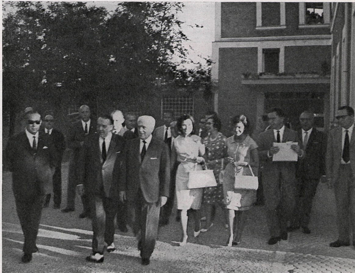
El ministro de la Gobernación cambia impresiones con otra de las enfermas del pabellón de Oncología. El señor Alonso Vega se preocupó meticulosamente sobre la situación y el trato que reciben en estas modernas instalaciones. A la derecha, el señor ministro y la marquesa de Villaverde, acompañados de autoridades y jerarquías, una vez terminado el acto inaugural.