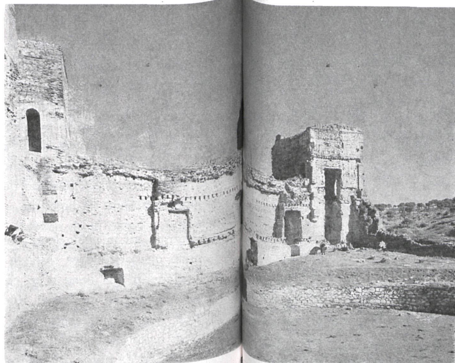
Gracias a las obras iniciadas por la Dirección General de Bellas Artes, en colaboración con la de Arquitectura, Buitrago recobrará su grandeza y volverá a ser uno de los rincones más interesantes de la provincia

Uno de los grandes encantos de este pueblo es el de estar rodeado por el río Lozoya, lo mismo que