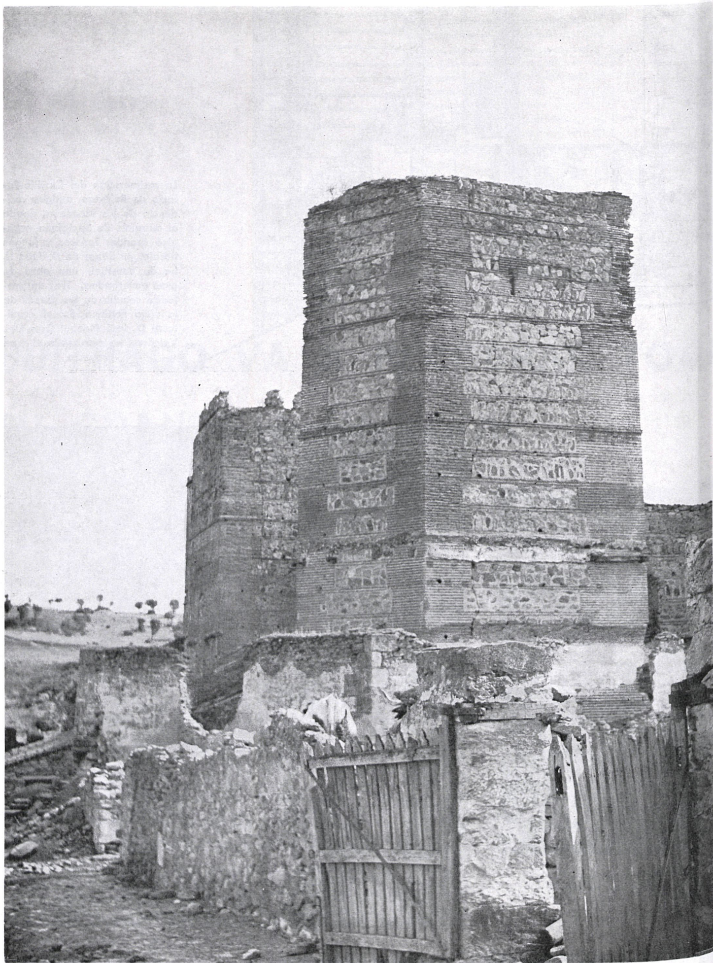
Severidad castrense es el castillo de Buitrago, ajeno a casi todo adorno superfluo. Sede de los Mendoza y, por lo tanto, sede en tiempos de muchas historias de amor. La villa, su castillo, sus almenadas murallas y sus torreones —como éste del grabado— van a ser reconstruidos por la Dirección General de Bellas Artes