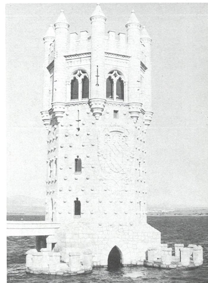
Presa de Santillana.

Junto al Canal de Isabel II tres Organismos más sirven hoy agua a los pueblos madrileños. Veinte núcleos del noroeste de la provincia se suministran a través de un sistema que actúa como Consorcio para el Abastecimiento de Agua a los pueblos de la Sierra de Guadarrama. En el coste de las obras ha intervenido la Diputación con el 50 por