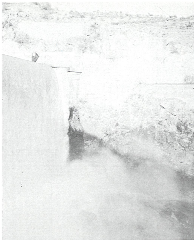
Presa del Pontón.

En los municipios más próximos a los que actualmente están servidos por el Canal de Isabel II "la disponibilidad de recursos se mantiene por encima de las