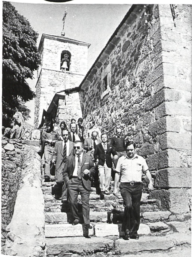
El presidente de la Diputación en Somosierra.